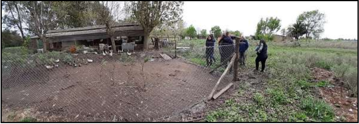
Granja Avícola San Jorge “La Sarita” Verónica (Punta Indio)