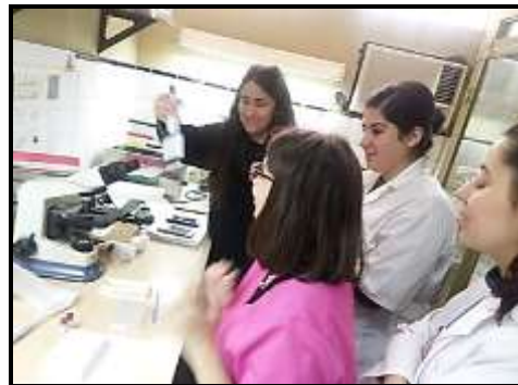
Figura 10. Laboratorio