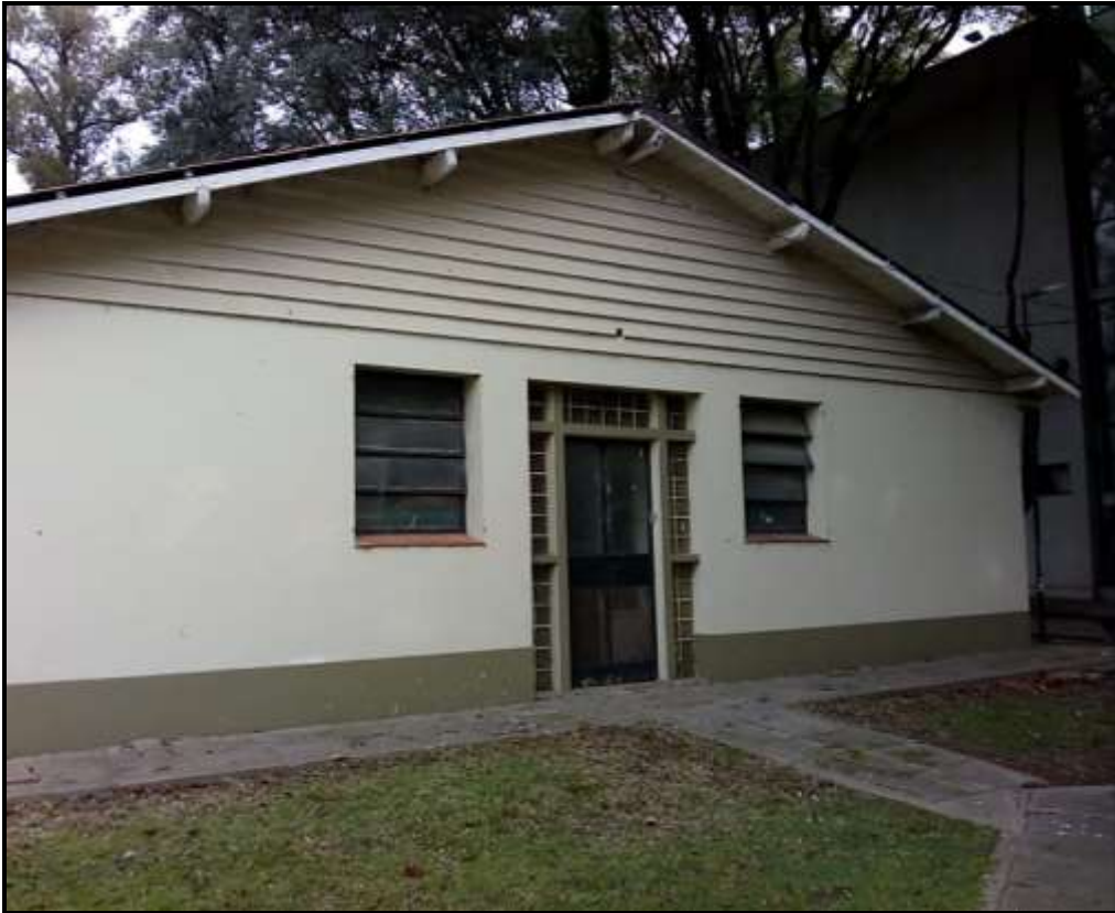
Figura 1. Área de Crianza. Facultad Ciencias Veterinarias. UNLP

Producción” Convocatoria Ordinaria 2018-19, con la Facultad de Ciencias Veterinarias de la Universidad Nacional de La Plata como unidad ejecutora, se logró poner en marcha este ambiente educativo llamado: “Área de Crianza” (Figura 1), un sitio pensado y realizado desde la integralidad