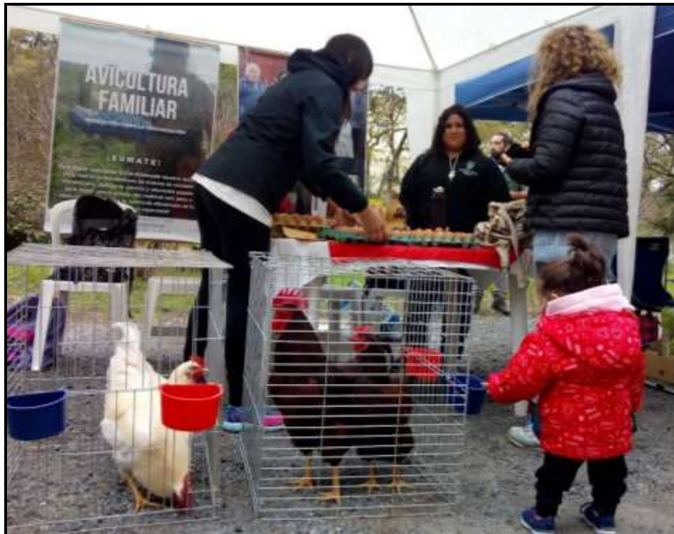
9° Jornadas de Agricultura Familiar. Facultad de Ciencias Veterinarias. UNLP