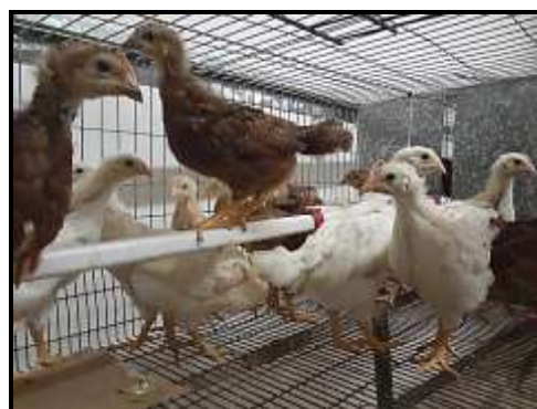
Figura 3. Pollitas de 30 días