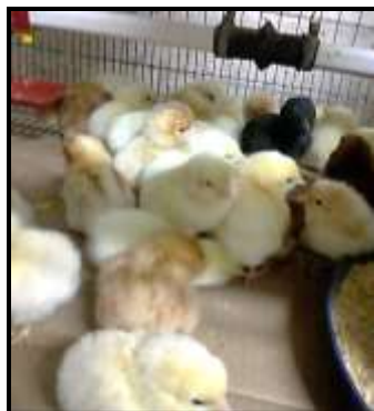
Figura 2. Pollitas de 2 días

Si bien había alumnos que participaban del proyecto desde el año anterior, en las semanas posteriores a la culminación de los arreglos en el área de crianza, pedí permiso a algunos docentes de distintos años de la carrera para contarles a los alumnos del proyecto de extensión e invitarlos a participar, con gran sorpresa muchos se vieron interesados y así comenzaron nuestras actividades. En dicho espacio, los alumnos realizaron prácticas relacionadas a la cría de pollitos y pollitas ponedoras hasta sus 30 días de vida (Figura 2 y 3). Dichos animales eran producidos por los diferentes centros de reproducción participantes del citado proyecto de extensión. La incubación de los huevos se realizaba en la incubadora del área de crianza. Los alumnos en un principio acompañados por los docentes extensionistas y luego solos, evaluaban parámetros ambientales, de consumo de alimento y bebida diarios, mortandad y morbilidad de los lotes, eficacia de conversión (Figura 4 y 5), además de la confección de registros emparentados con las prácticas realizadas.