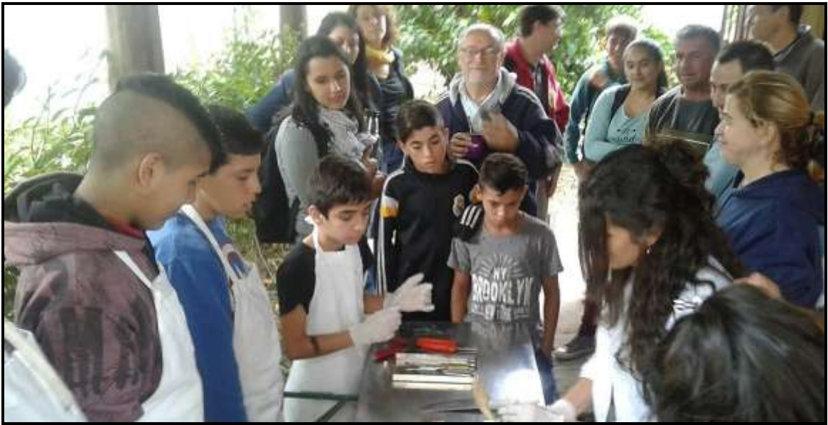
Capacitaciones Escuela Agraria N°1 Berisso