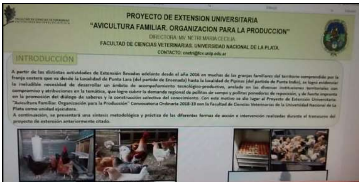
Trabajo (poster) 9° Jornadas de Agricultura Familiar. Facultad Ciencias Veterinarias. UNLP