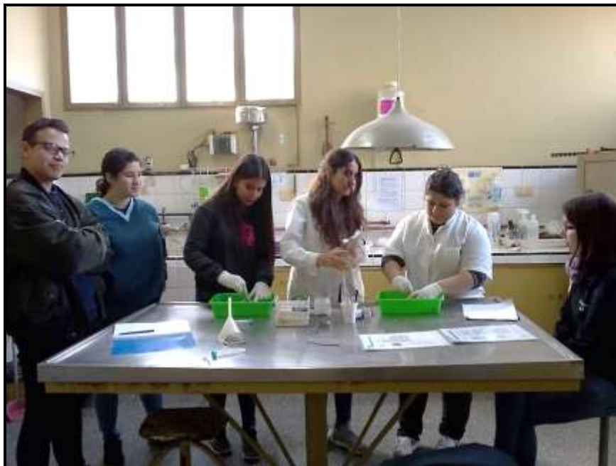
Figura 8. Embriodiagnosis

En el transcurso de las actividades iban surgiendo distintas problemáticas, pongamos por caso los bajos índices de incubación de pollitos bb, los pollitos no nacidos en la unidad de incubación, en consecuencia se procedió a realizar embriodiagnos (Figura 8) para así poder determinar las probables causas y evaluar su eventual resolución, estas actividades las realizaron los alumnos, con el docente como moderador, ellos hacían la practica con el material de lectura correspondiente al lado, unos leían, otros abrían los huevos, clasificaban los estadios y otro registraba los datos, al final se hacía la puesta en común, se analizaban las probables causas y resoluciones a la problemática acontecida.