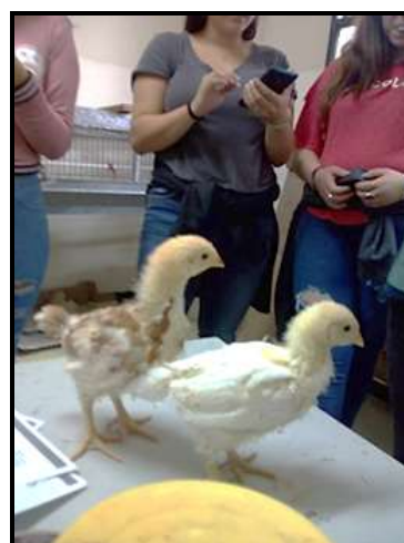
Figura 5. Pesaje de pollitas