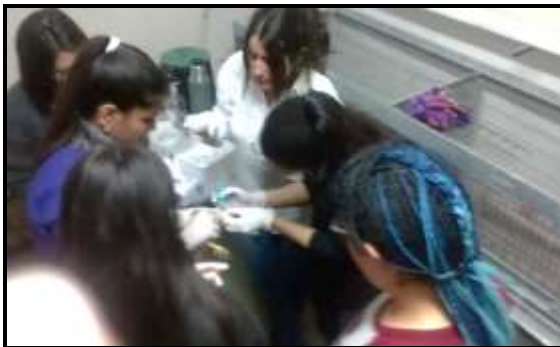
Figura 9. Vacunación

Concluido todo el proceso se preparaban los animales y se entregaban en el Barrio Arco Iris (Punta Lara, Ensenada), en Verónica (Punta Indio) y alrededores los alumnos extensionistas concurrían y se hacían capacitaciones cortas sobre los primeros cuidados que debían prodigar a sus aves (Figura 12)