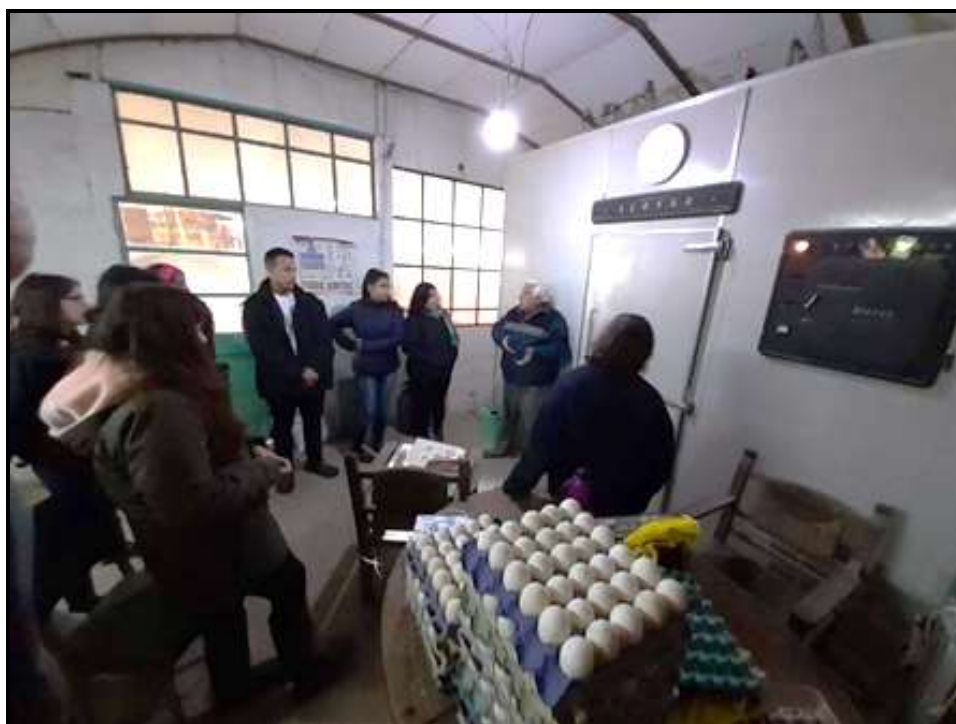
Sala de Incubación Granja Avícola San Jorge "La Sarita" Verónica (Punta Indio)