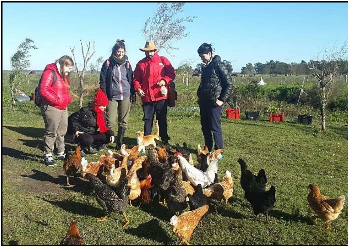
Visita a los avicultores del Barrio “Arco Iris” Punta Lara. Ensenada