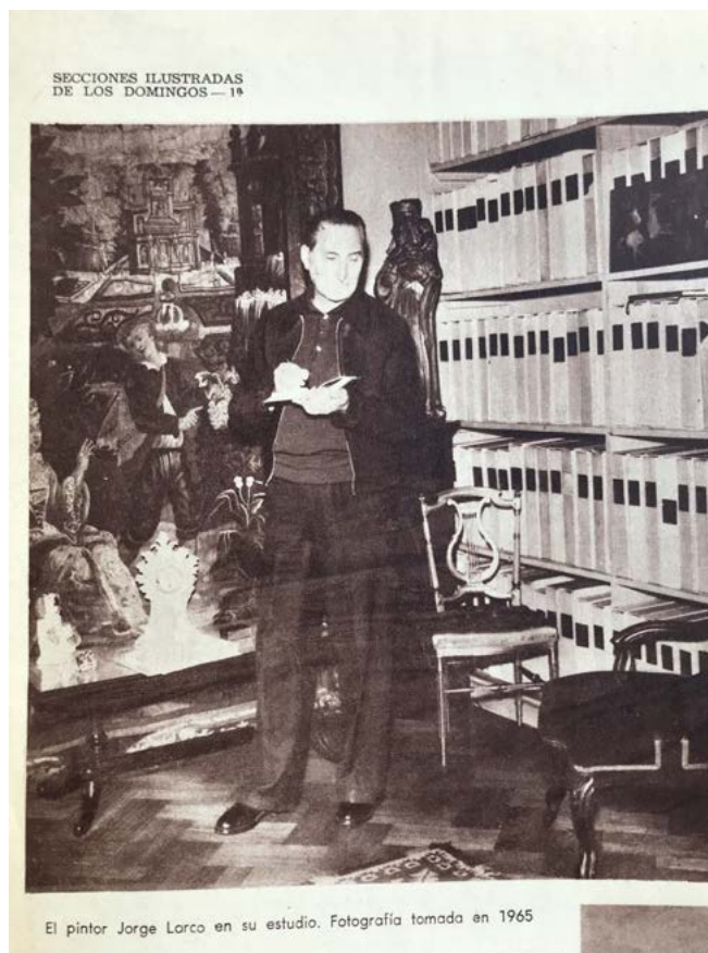
Figura 1. Larco en el estudio. Retrato aparecido en La Prensa en noviembre de 1967

El 5 de noviembre de 1967, el matutino porteño La Prensa dedica una página de la sección ilustrada a la obra del pintor Jorge Larco, fallecido días atrás. En la esquina superior izquierda, el diario de los Paz dispone un retrato fotográfico del artista. La fotografía lo toma de cuerpo entero; con la mano izquierda, mantiene abierto un cuaderno de notas mientras que con la diestra sostiene en el aire un instrumento de escritura. A su espalda, un tapiz cierra el fondo en el flanco izquierdo. Detrás suyo, se encuentra la virgen gótica que tiempo después pasaría a ser propiedad del Museo Nacional de Bellas Artes. Al otro lado de la figura humana, la pared despliega cinco estantes de cajas rotuladas y prolijamente enfiladas [Figura 1]. La imagen pública del artista emerge de este modo en el intervalo donde se tocan la colección y el archivo. El epígrafe de la imagen especifica que el pintor se encuentra «en su estudio» (Obras del pintor, 1967, s. p.).