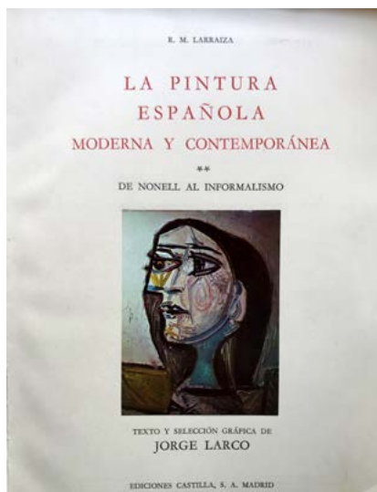
Figura 3. La pintura española moderna y contemporánea . Portada del segundo tomo