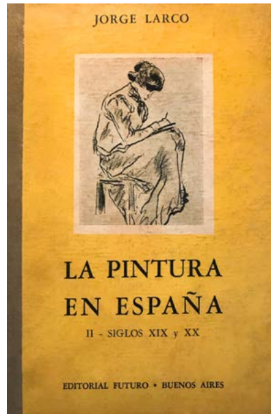
Figura 2. La pintura en España. II. Siglos XIX y XX (1947). Publicado en la colección El Hilo de Ariadna de la editorial Futuro

Los dispositivos gráficos de la colección naturalizaban esta imagen del autor como un cicerone: en las hojas de guarda, cada libro desplegaba un mapa del territorio artístico estudiado, en este caso, de España. La captatio benevolentiae de Larco no solo sugiere el contacto con esa Europa imaginada como fuente del arte y del sentido, sino que da un paso más en la escala de proximidad: su legitimidad descansa en el hecho de haber estado en el taller de los pintores.