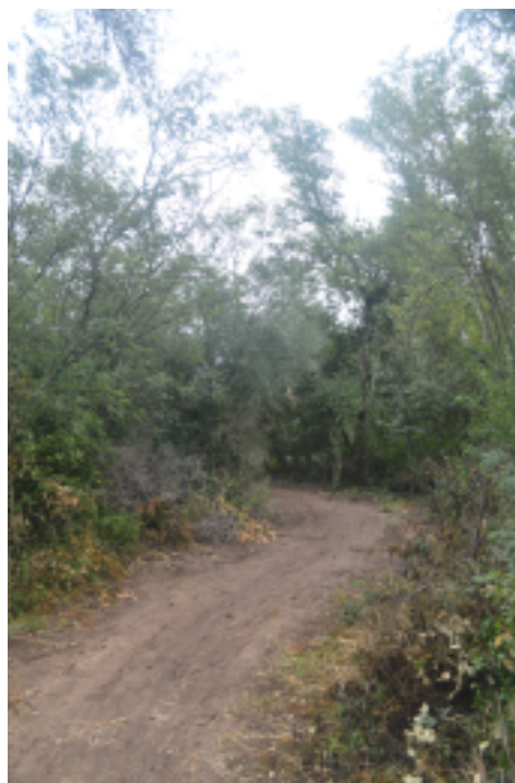
Figura 5. Camino ( nyic ) que se interna en el monte ( 'oochi ), Santa Rosa, Pcia. de Chaco, Argentina, 2013.

Bajo ciertas circunstancias, como ya detallaremos,