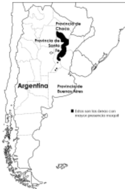
Figura 1. Mapa de la zona de mayor presencia de los moqoit .

Actualmente los moqoit viven en comunidades rurales, urbanas y periurbanas, principalmente en las provincias de Chaco y Santa Fe. Su población es de alrededor de 18.000 personas (INDEC 2015). Hemos realizado trabajo de campo etnográfico en las comunidades de Santa Rosa, San Lorenzo (parte de la Colonia General Necochea o Colonia Cacique Catán), Colonia Juan Larrea, El Pastoril, San Bernardo, Colonia Aborigen Chaco de la provincia del Chaco, y Recreo y Tostado de la Provincia de Santa Fe.