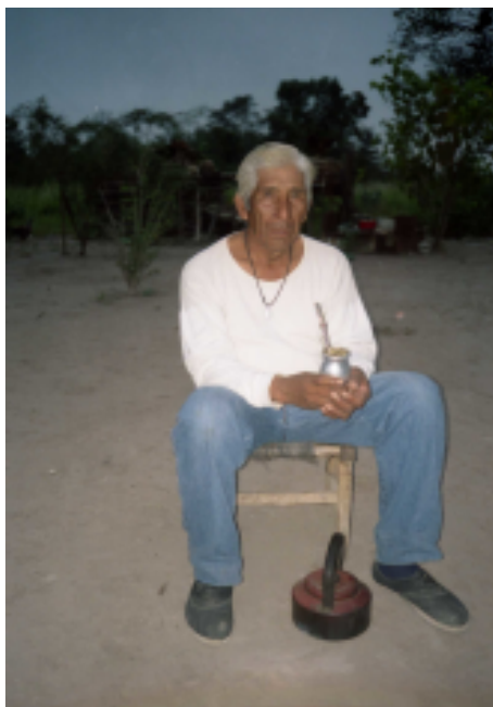
Figura 8. Los ancianos suelen levantarse antes del amanecer. El mate y el silencio caracterizan este período, en el que se dan muchas experiencias del cielo. Santa Rosa, Pcia. de Chaco, Argentina, 2007.

jornada, pidiéndole fuerza y animando a los niños a levantarse. Era muy habitual su uso para la primera mitad del siglo XX. Varios interlocutores nos relataron que solían ser las abuelas quienes levantaban de este modo a sus nietos. En algunas de dichas oraciones se usa una denominación para "la Sol", Larrimina , diferente de la usual ( ra'aasa ) y que es señalada como "antiguo" o "verdadero" moqoit . Hoy día las horas previas al amanecer suelen ser el tiempo de esperar al patrón criollo que pasa a recoger a quienes se dirigen a trabajar en sus campos, o de salir caminando para llegar al pueblo cercano