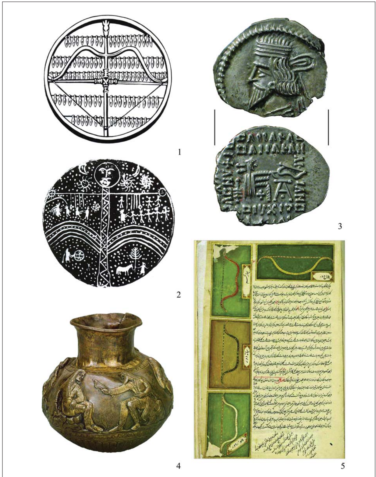
3. kép 1: Mongol íjas dob; 2: Altaji sámándob felnyilazott íjjal, háttérben a csillagképekkel; 3: III. Vologases pártus király (Kr. u. 105–147) ezüst drahmája; 4: A voronyezsi Csasztüje kurgán ezüst korsója (Kr. e. 4. század); 5: Mameluk kori íjászkönyv (14. század)