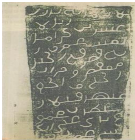
Rajah 1. Tiang Champa (1035 CE)