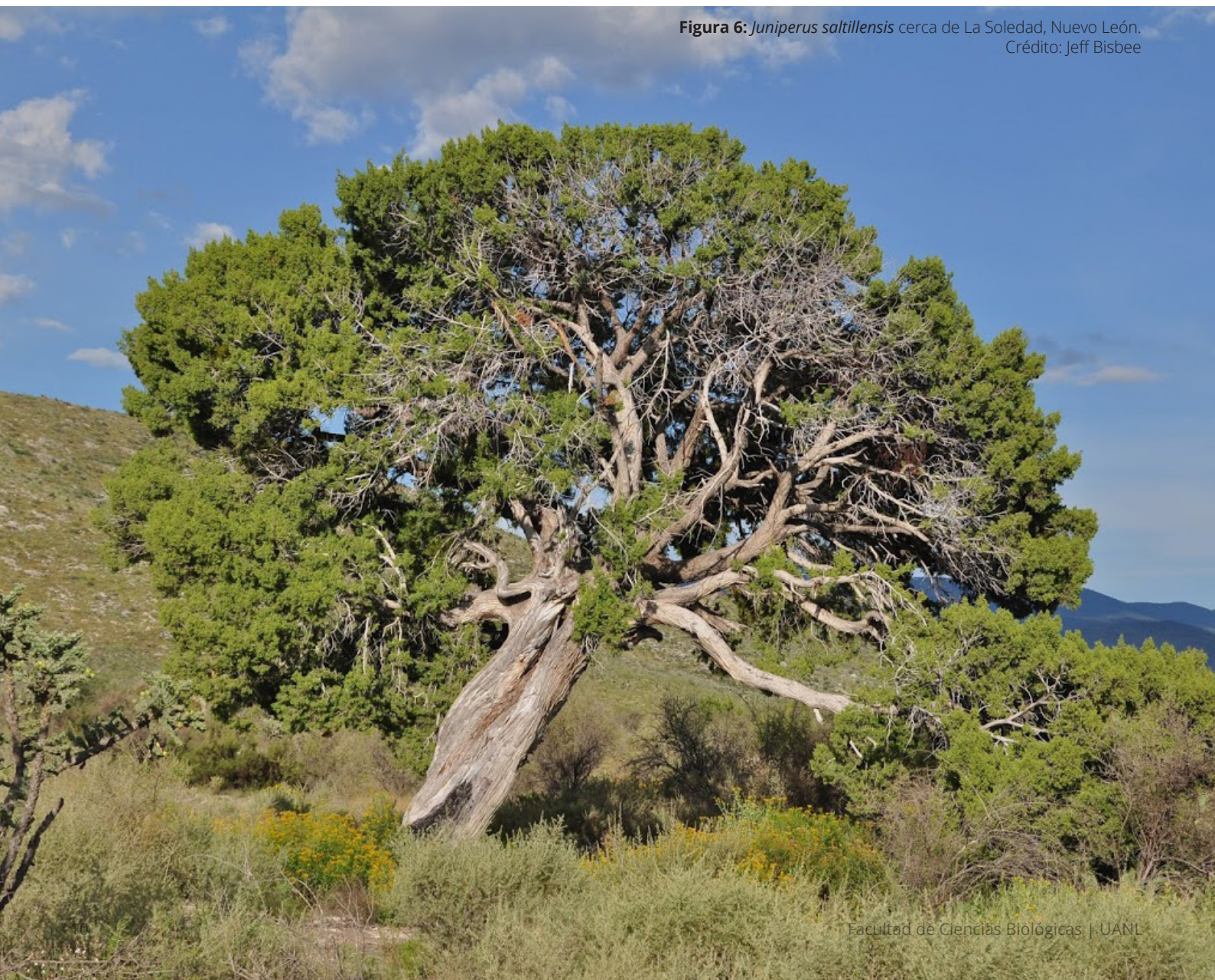
Figura 6: Juniperus saltillensis cerca de La Soledad, Nuevo León.