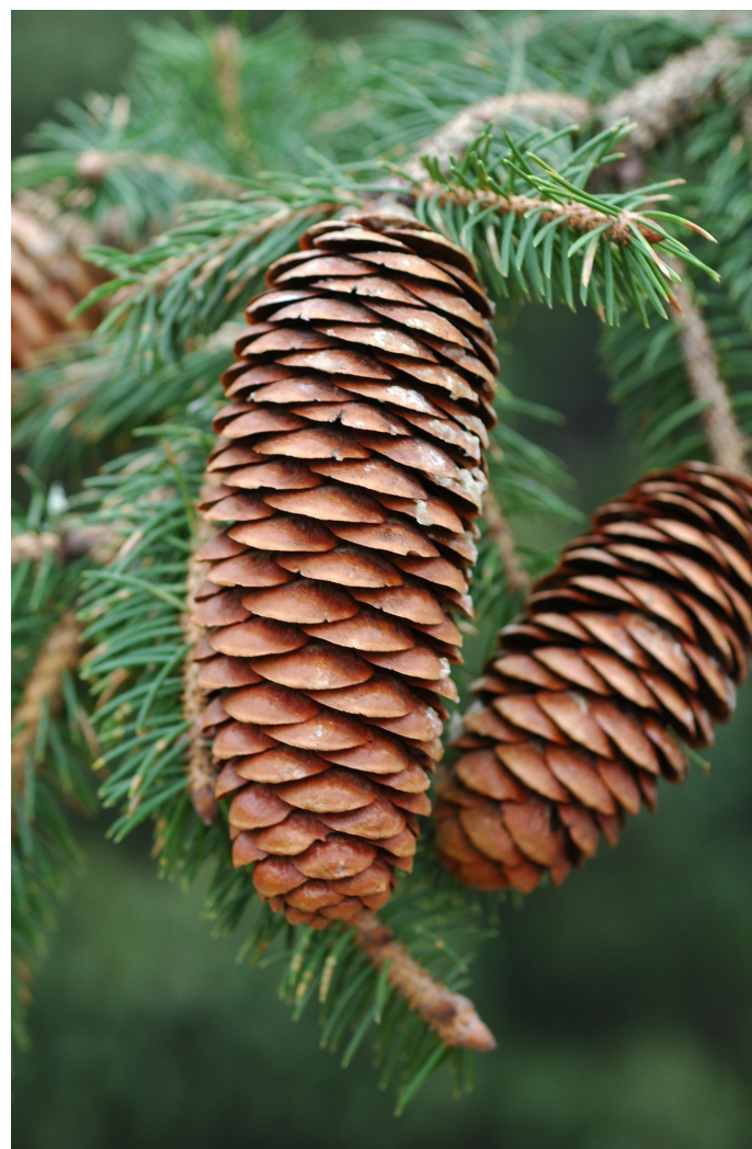
Figura 5: Conos de Picea martinezii .