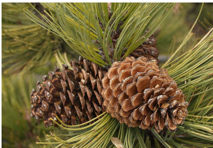
Figura 2: Estróbilo ovulífero de Taxus globosa en General Zaragoza, Nuevo León.