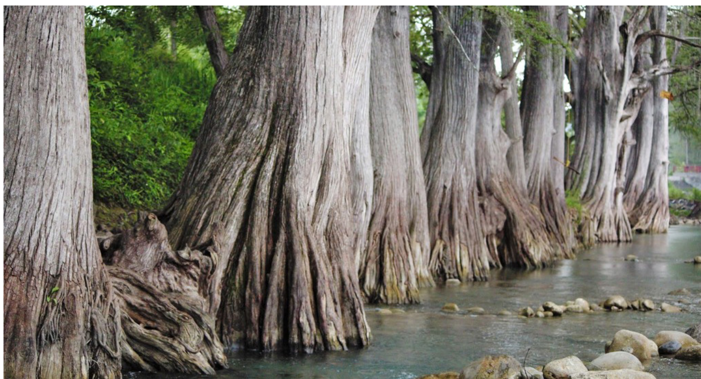
Figura 3: Sabinos o Ahuehuetes ( Taxodium mucronatum ), árbol nacional de México, formando el bosque de galería en Allende, Nuevo León.

En el Altiplano Mexicano y las llanuras orientales del estado (correspondientes a las Llanuras Costeras del Golfo de México y las Grandes Llanuras de Norteamérica) se presentan pocas especies de coníferas. Taxodium mucronatum es, indudablemente, la más abundante en ambas regiones, habitando en las riberas de ríos y arroyos