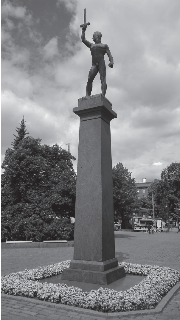
Kuvanveistäjä Viktor Janssonin tekemä Vapaudenpatsas pystytettiin Tampereen Hämeenpuistoon 1921.