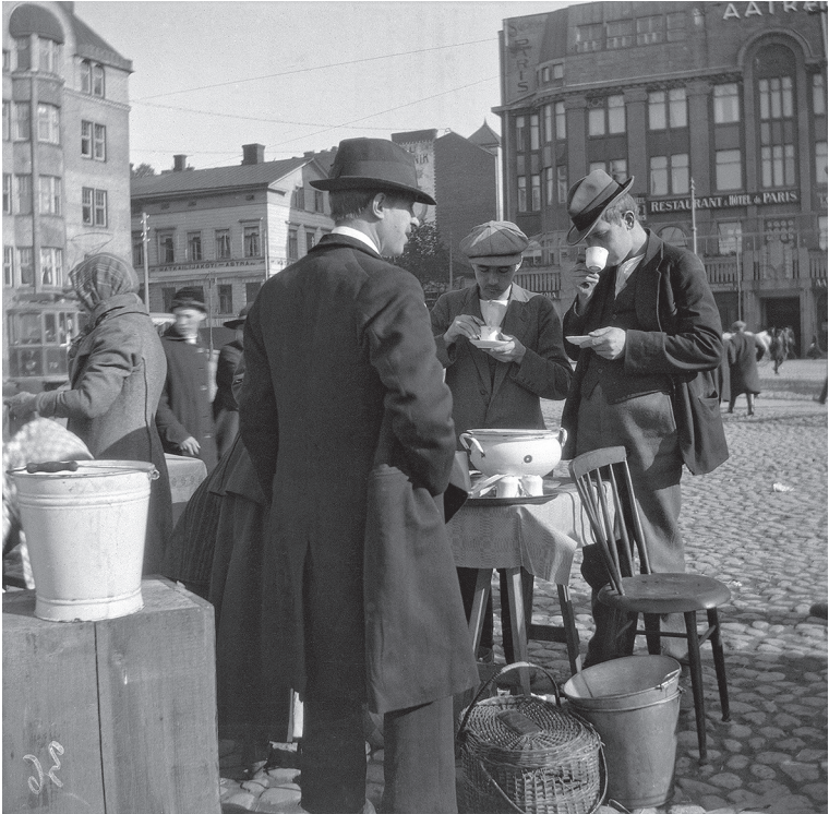
Kahvitarjoilua Rautatientorilla vuonna 1918. Kahvi, tee ja muut lämpimät juomat olivat tärkeitä nautintoaineita, jotka poikkeusaikana kiinnittivät ihmisiä normaaliuden tunteeseen.

oli nuori säveltäjänalku Aarre Merikanto, jonka perheelleen kirjoittamat kepeät ja leikkisät kirjeet kertovat paitsi piristeiden tarpeesta myös pintaa enemmän vankeusajan tunnelmista. 32 Hänellä oli mahdollisuus säveltää, lukea ja nauttia perheeltään saamia herkkuja, mutta se tärkein, vapaus, kuitenkin puuttui, kuten 9. huhtikuuta kirjoitetusta kirjeestä ilmenee: