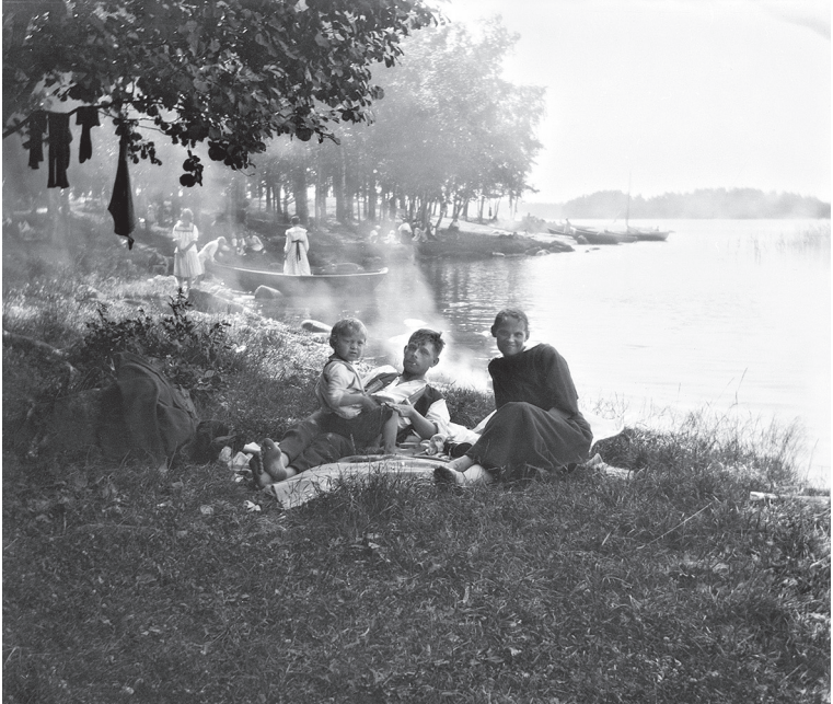
Nuori perhe viettämässä kesäpäivää Seurasaaressa vuonna 1917, suloisessa, menetetyssä lähimenneisyydessä. Monen kohdalla saarielämä vaihtui seuraavana kesänä tyystin toisenlaiseen.

1918. Perinteet ja traditiot toivat turvaa ja normaaliuden tunnetta.