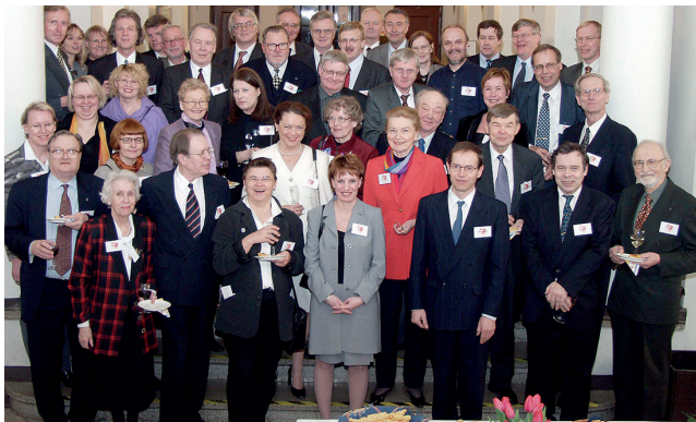
Tiedeliitto 30 vuotta -juhlaseminaari Helsingissä 2002.