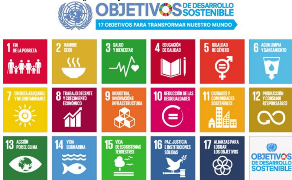
Figura 1. Objetivos de Desarrollo Sostenible

colaboración conjunta de los diversos actores y sectores sociales, entre los que destacan, el sector gubernamental, el sector académico, el sector empresarial y la sociedad civil organizada; en busca de asumir un papel activo y eficaz en la integración del plan y de las estrategias comunes enfocadas en la armonía, la paz y bienestar de las personas y del planeta (Muñoz-Torres, Fernández-Izquierdo, Rivera-Lirio, Ferrero-Ferrero, Escrig-Olmedo, Gisbert-Navarro, y Chiara-Marullo, 2018) (ver Figura 1).