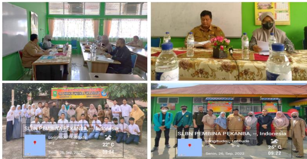
Gambar 6. Kegiatan Penyuluhan, Pelatihan dan Bimbingan