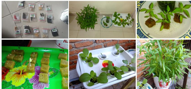
Gambar 4. Proses Pemilihan dan Penyemaian Benih