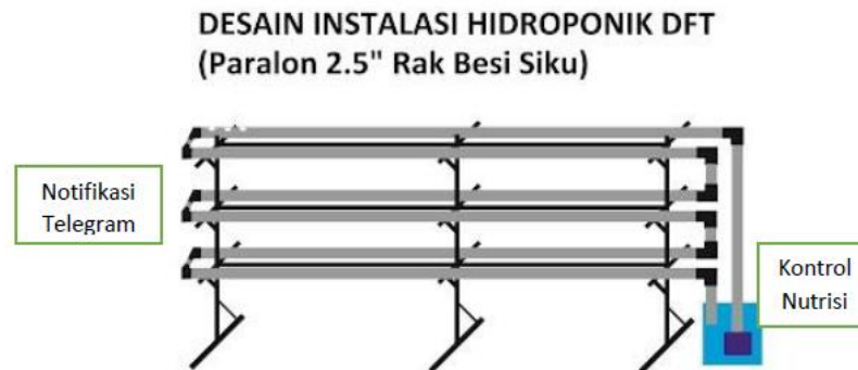
Gambar 3. Desain Instalasi Hidroponik Berbasis IoT

Berikut gambaran Produk Berbasis IoT yang akan dihasilkan :