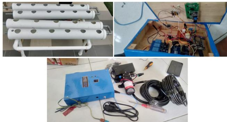
Gambar 5. Perakitan Alat IoT Hidroponik