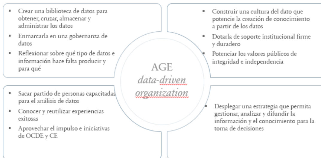
FIGURA 3: PROPUESTAS DE MEJORA PARA CONVERTIR A LA AGE EN UNA DATA-DRIVEN ORGANIZATION