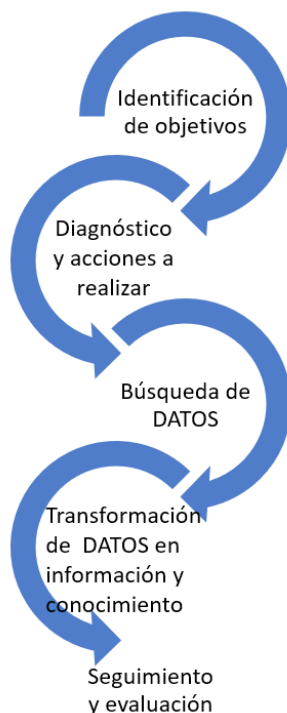
FIGURA 2: CICLO DE TRABAJO DE LAS UNIDADES DE TRATAMIENTO Y ANÁLISIS DE DATOS