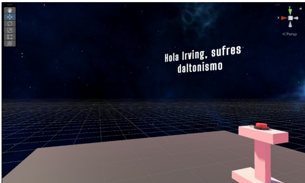
Figura 3. Resultados del diagnóstico.

En la figura 3 se muestra la pantalla de los resultados que se muestran al finalizar la prueba, los cuales incluyen el nombre del paciente y su diagnóstico en base a sus respuestas.