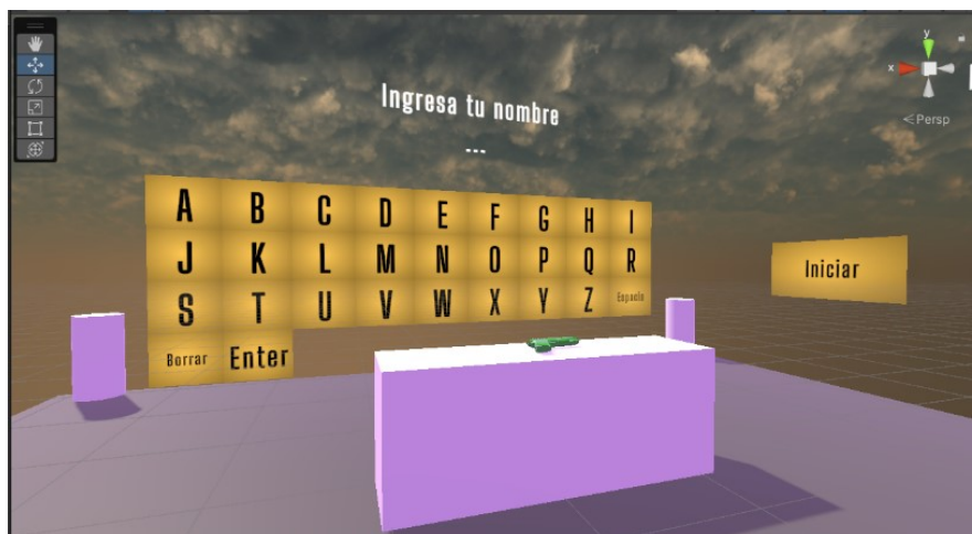
Figura 1. Ingreso de datos personales

En la figura 1 se muestra la primera pantalla del agente inteligente donde el paciente registra sus datos personales.