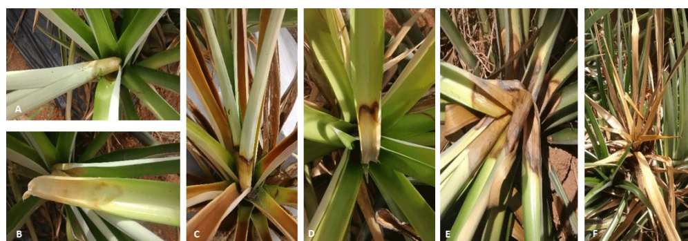
Figura 3. Plantas en campo con sintomatología presuntiva a PHRD. A y B: Hojas con sintomatología inicial. C y D: Hojas con sintomatología intermedia. E y F: Hojas con sintomatología avanzada / Plants in the field with presumptive symptoms of PHRD. A and B: Leaves with early symptoms. C and D: Leaves with intermediate symptoms. E and F: Leaves with advanced symptoms.

De los 77 lotes explorados, se detectaron 19 lotes con presencia de pudrición basal, correspondientes a 14 fincas ubicadas en los seis municipios en estudio. Se observó un mayor número de lotes con presencia de la enfermedad en etapa de desarrollo vegetativo (8), con un nivel de afectación medio (4) y bajo (4), seguidos de lotes en etapa de cosecha (5) y fructificación (3) en los tres niveles de afectación. Sin embargo, en las etapas de fructificación, cosecha y producción de semilla se observó un lote con nivel de afectación alto para la enfermedad.