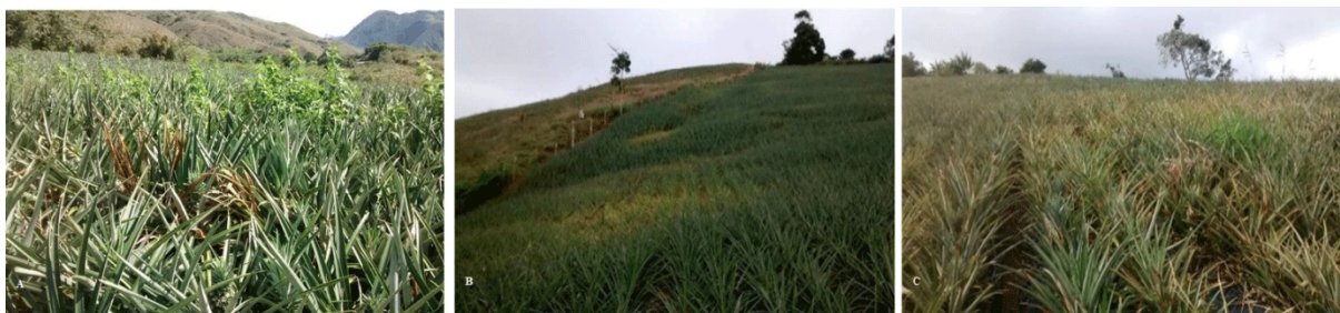
Figura 2. Distribución de la pudrición basal en lotes del cultivo de piña. A. Distribución aleatoria. B. Distribución agregada. C. Distribución uniforme / Distribution of heart and root rots in pineapple cultivated plots. A. Random pattern of distribution. B. Aggregated pattern of distribution. C. Uniform pattern of distribution.

permitió la descripción del avance de la sintomatología, a partir del cual se sugieren tres niveles de infección en el cultivar MD2 categorizados como: inicial, intermedio y avanzado. Los síntomas iniciales observados fueron hojas cloróticas, lesiones en la base y en el cogollo, que pueden iniciar con presencia de tejido blando y mal olor, sin un halo de infección definido (Fig. 3A y 3B). En las plantas con síntomas intermedios, se observaron hojas cloróticas a rojizas, con un halo de infección definido y olor fétido en la base, que pudieron presentar inclinación o volcamiento (Fig. 3C y 3D). Finalmente, en las plantas con sintomatología avanzada se observaron hojas color marrón, marchitez generalizada, lesión basal de hojas color marrón oscuro, olor fétido y colapso de la planta (Fig. 3E y 3F).