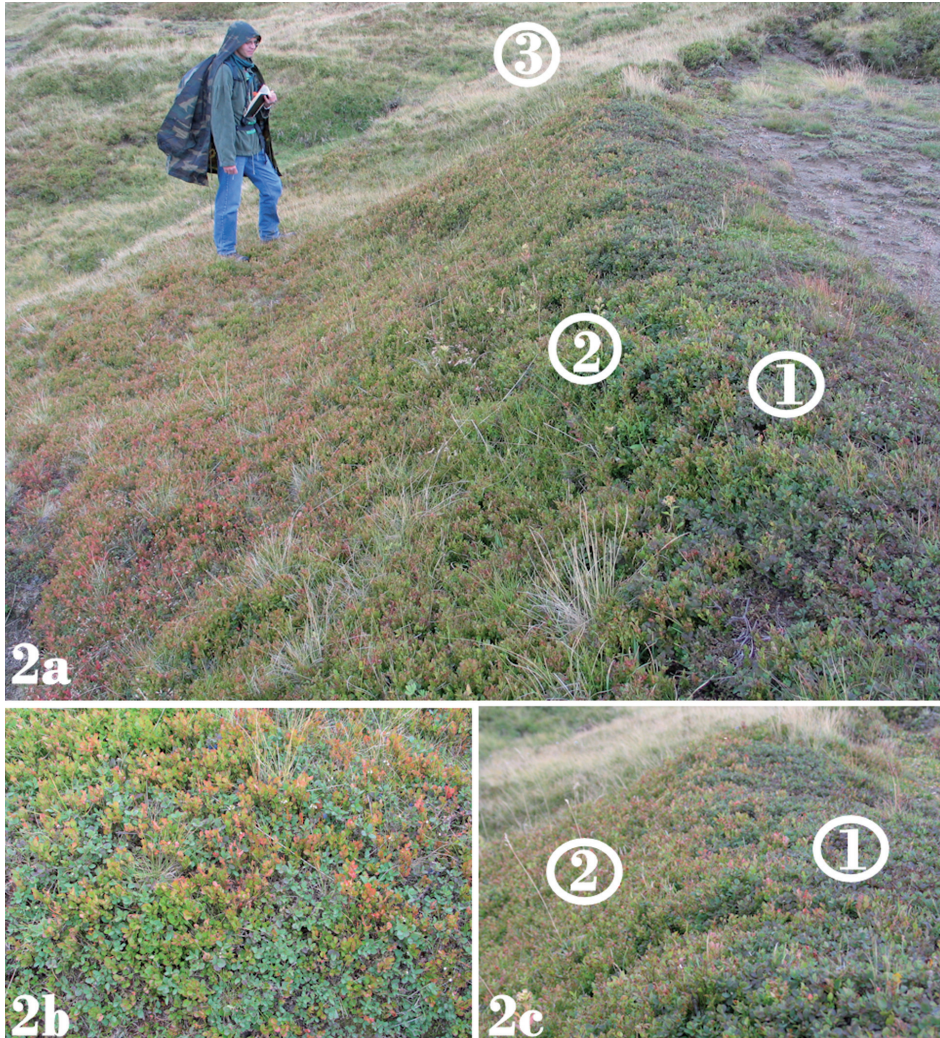
Fig. 2 - 2a: Il popolamento di Vaccinium gaultherioides dei Monti della Laga (Pizzo di Sevo). (1) Vaccinium gaultherioides ; (2) Vaccinium myrtillus ; (3) popolamenti a Nardus stricta nelle linee di impluvio. 2b: Un esempio di popolamento misto a Vaccinium dove sono mescolati Vaccinium myrtillus (foglie color verde) e V. gaultherioides (foglie color azzurrognolo). 2c: Differente attitudine ecologica delle due specie di mirtillo. (1) Vaccinium gaultherioides si posiziona sul ciglio del gradone dove permanendo la copertura nevosa per un tempo minore la specie è spesso sottoposta a fasi di marcata escursione termica e all'azione dei freddi venti invernali. (2): Vaccinium myrtillus si posiziona lungo il versantino del microdosso dove la prolungata copertura nevosa protegge la specie da fasi di escursione termica troppo marcata

Completamente differente è il contesto cenologico del Gran Sasso, dove le uniche specie in comune con i Monti della Laga sono Luzula spicata subsp.