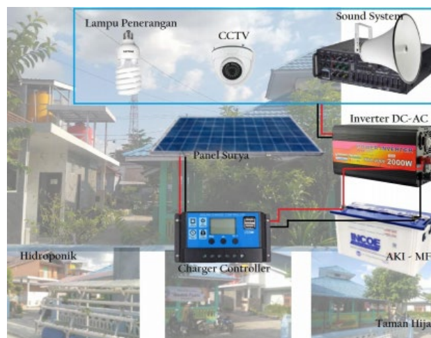
Gambar 1.3. Skema Teknologi Energi Terbarukan berbasis Sel Surya

Target yang ingin dicapai dalam Program Kemitraan Masyarakat (PKM) berupa peningkatan efisiensi daya listrik terpakai yang memanfaatkan sumber energi terbarukan dari sel surya sebagai sumber energi listrik utama, pemahaman dan transfer keterampilan instalasi dan perawatan teknologi sel surya. Adapun luaran dari pengabdian masyarakat ini adalah Instalasi jaringan listrik berbasis sel surya yang dapat menjadi sumber listrik utama untuk penerangan, kipas angin, power supply CCTV, Sound System, dan Pompa Hidroponik Sementara sumber energi listrik cadangan berasal dari PLN dan Genset di Mushola Nurul Hikmah. Teknologi ini diharapkan dapat membantu mengatasi permasalahan di Mushola Nurul Hikmah. Alat ini terdiri dari Sel Surya, Solar Charger Controller, Inverter, MCB, dan Aki Maintenance Free. Seperti yang ditunjukkan pada Gambar 1.3.