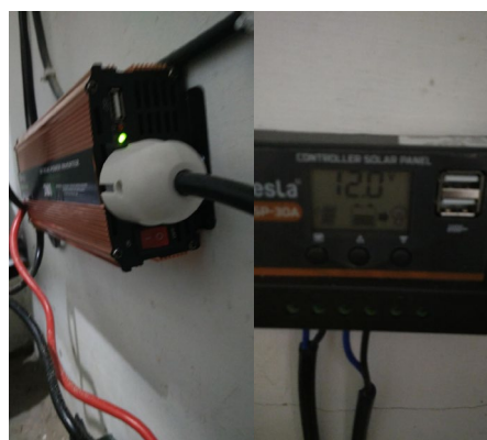
Gambar 1.5. Pemasangan instalasi panel surya di Mushola Nurul Hikmah