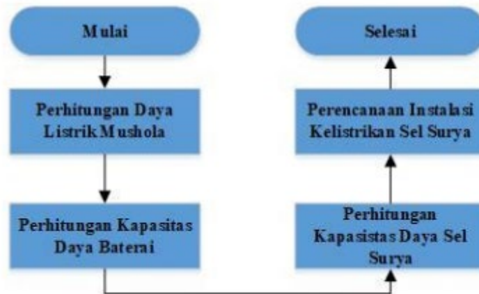
Gambar 1.1. Perencanaan Teknologi Sel Surya

Perencanaan teknologi sel surya terdiri dari beberapa tahapan yang perlu untuk dilakukan. Adapun dari perencanaan ini ditunjukkan pada gambar 1.1.