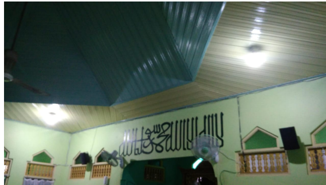
Gambar 1.6. Uji coba penyalan lampu hasil instalasi panel surya di Mushola Nurul Hikmah