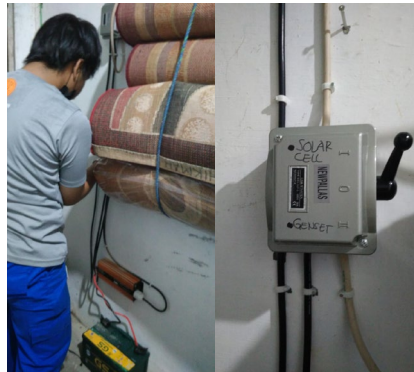
Gambar 1.4. Pemasangan instalasi panel surya di Mushola Nurul Hikmah

Setelah penginstaliran alat dan pelengkap instalasi tenaga surya telah dilakukan langkah selanjutnya adalah memastikan apakah instalasi tenaga surya yang kita pasang bekerja sesuai rancangan, gambar 1.6. adalah gambar uji coba pengoperasian sel surya di mushola nurul hikmah.