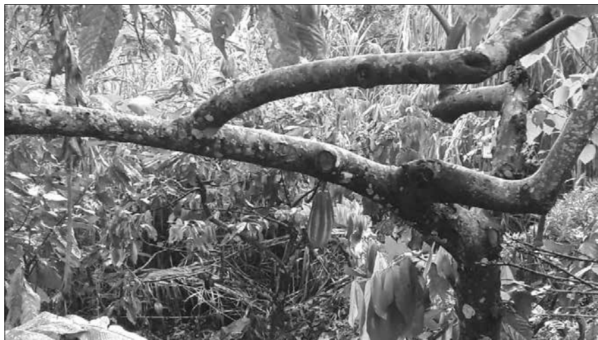
Imagen 1. Árbol de cacao.

La caracterización de las fincas nos permite observar las oportunidades para el turista.