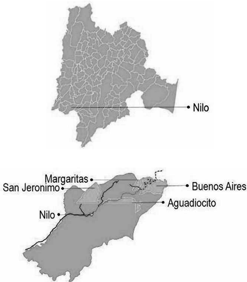
Figura 1. Localización departamental y municipal del área recorrida en el proceso de campo.

El uso de cartografía se realizó con la información actualizada de las bases de datos geográficas en escalas 1:100.000 y 1:25000 publicada por el IGAC, con la cual se identificaron las cédulas catastrales de los predios, su longitud y extensión, para luego unir esta información y emitir los productos visuales y cartográficos que a continuación se exponen.