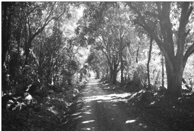
Imagen 3. Tramo vía de acceso finca San Luis.