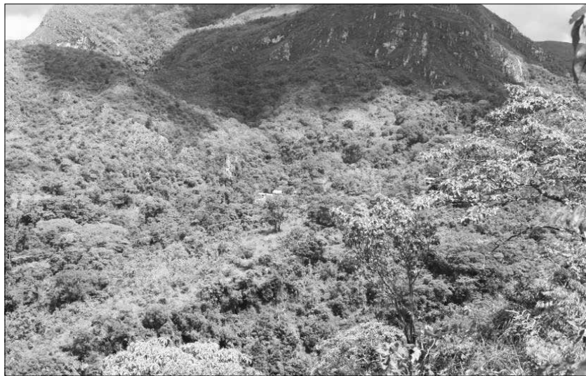
Imagen 2. Panorámica de finca San Luis.