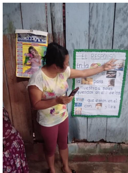
Cuento con pictogramas elaborados por las estudiantes