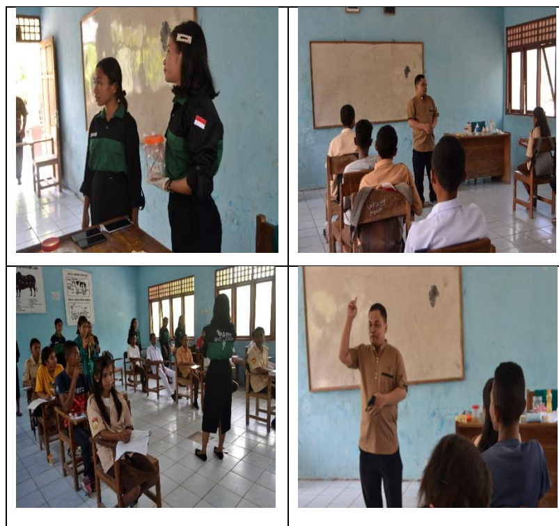
Gambar 2 Penyampaian Materi Terkait Insektarium

Pengabdian dimulai Pada pukul 08.00 dengan terlebih dahulu melakukan koordinasi dengan pihak terkait kegiatan. Setelahnya masuk pada tahap pemberian materi tentang insektarium yang meliputi pengertian insektarium, jenis-jenis insektarium, dan teknik pembuatan insektarium ( gambar 2 ).