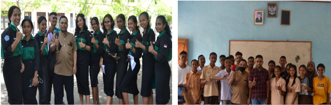
Gambar 4 Tim Pengabdian

Kegiatan pengabdian selesai pada jam 12.00 wita yang dilanjutkan dengan sesi foto bersama peserta dan tim pengabdian di SMK Wini. Pelaksanaan Kegiatan pengabdian ini mendapat respon yang sangat baik dari peserta pengabdian. Semua peserta sangat antusias dalam mengikuti kegiatan dari awal sampai akhir. Sekolah Mitra berharap kegiatan serupa sering dilaksanakan guna menambah wawasan pengetahuan siswa tentang biodiversitas dan cara memanfaatkan makhluk hidup sebagai sumber belajar.