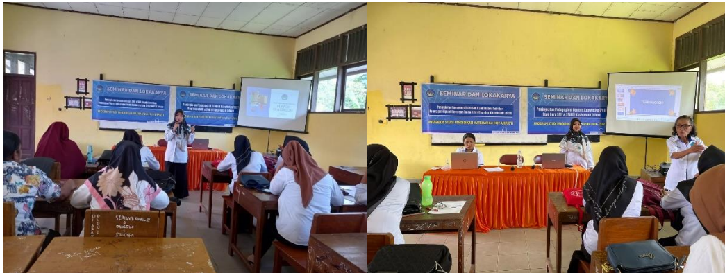
Gambar 1. Penyampaian materi dari narasumber

Menurut (Bergmann & Sams, 2014) Flipped classroom merupakan metode pembelajaran yang inovatif dan berpusat pada anak dengan membalik strategi pembelajaran yang dilakukan. Dalam pembelajaran campuran ( Blended Learning ), kegiatan belajar yang biasanya dilakukan dirumah dibalik menjadi kegiatan yang dilakukan disekolah. Beberapa praktik baik penerapan flipped classroom telah dilakukan dalam berbagai mata pelajaran dan berbagai tingkat pendidikan. Salah satunya adalah penerapan flipped classroom dengan bantuan Google Classroom dalam pembelajaran matematika SMP yang dilakukan oleh (Kurniawati et al., 2019) yang mengungkapkan bahwa proses pembelajaran flipped classroom berjalan baik dengan antusiasme yang tinggi dari para guru (peserta). Dalam sesi pelatihan ini, guru dikenalkan dengan konsep flipped classroom , Langkah-langkah dalam pelaksanaannya serta penerapannya dalam pembelajaran.