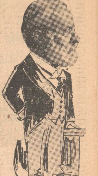
L'HONORABLE SENATEUR F.-L. BEIQUE, président de la Banque Canadienne Nationale, qui présidera la 1ère soirée de la saison de la Société des Conférences de l'École des Hautes Etudes Commerciales, ce soir, le 15 décembre à la salle Saint-Sulpice. (Croquis d'un dessinateur de la "Presse").