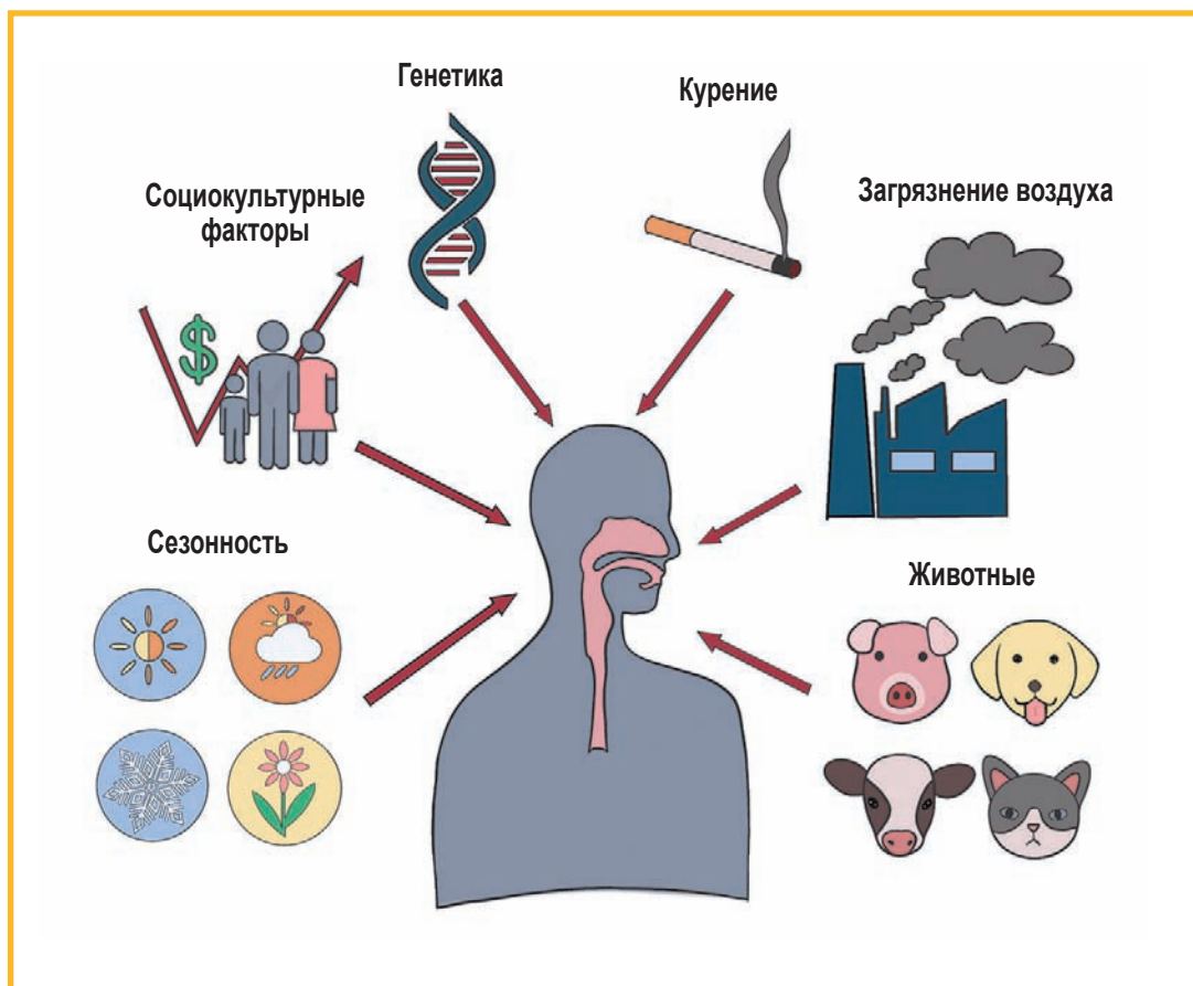
Рис. 2. Факторы, оказывающие влияние на микробиом верхних дыхательных путей человека

Согласно данным ряда исследований, состав микробиоты ВДП может быть обусловлен генетическими факторами, в частности вариациями генов паттерн-распознающих рецепторов, которые связываются с компонентами бактериальных клеток, запуская каскад реакций врожденного иммунитета. Такие рецепторы, как TLR2 и TLR4, способны связываться с компонентами клеток грамположительных и грамотрицательных бактерий соответственно. Известно, что аллельные полиморфизмы данных генов приводят к снижению активности соответствующих рецепторных белков, что может, в свою очередь, определять соотношение грамположительных и грамотрицательных бактерий в микробиоме. Так, найдена ассоциация между полиморфизмами генов Toll -подобных рецеп-