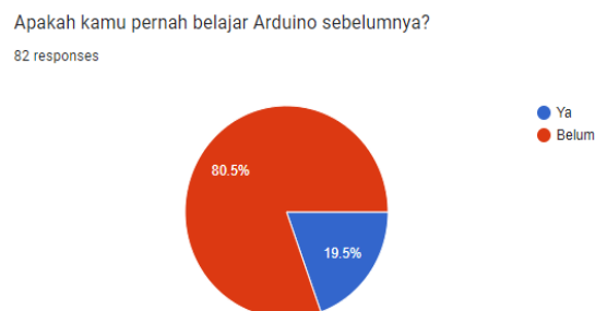
Gambar 1 Respons peserta pelatihan terkait pengalaman belajar menggunakan Arduino sebelumnya

Gambar 1 menunjukkan bahwa 80,5% responden menyatakan belum pernah belajar Arduino sebelumnya.