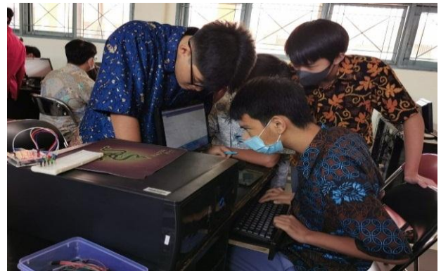
Gambar 3 Peserta melakukan pengkodean IDE Arduino dan membuat rangkaian LED

instruksi maupun quiz yang diberikan. Pengkodean yang dilakukan kemudian diupload ke mikrokontroler Arduino. Selain itu, Gambar 4 menunjukkan foto bersama tim dosen Universitas Buddhi Dharma sebagai pengajar dengan para peserta pelatihan.