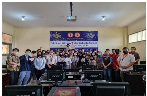
Gambar 4 Foto bersama para pengajar dan pelajar