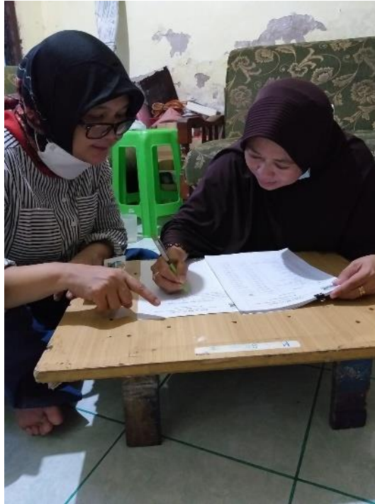
Gambar 2. Pendampingan Pencatatan Akuntansi