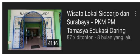
Gambar 13. Video keempat TARING di Youtube