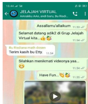
Gambar 20. Grup Jelajah Virtual