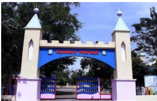
Gambar 16. Rumah Pintar Sidoarjo