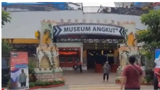
Gambar 12. Cuplikan Layar dari Video TARING