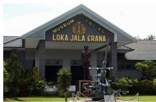
Gambar 17. Museum TNI-AL Juanda