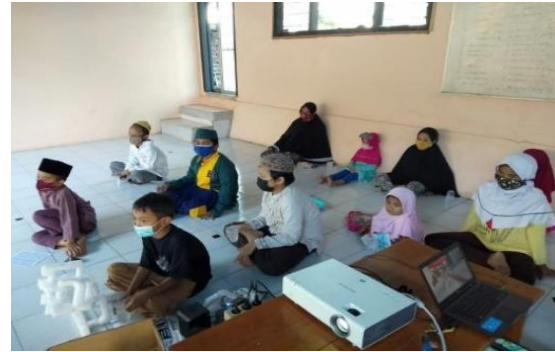
Gambar 5. Peserta Didik sedang Menonton Video Tamasya dan Mengisi Kuisoner