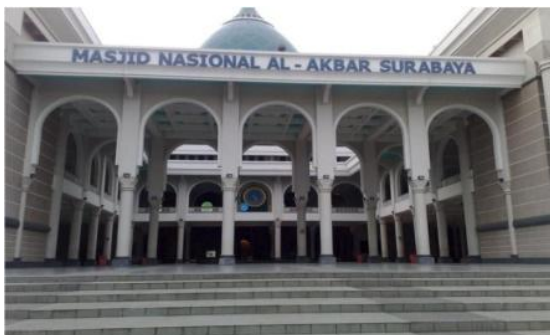
Gambar 18. Masjid Al-Akbar Surabaya