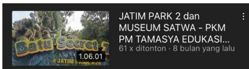
Gambar 6. Video pertama TARING di Youtube

Analisis untuk respons peserta didik dikatakan positif jika persentase dari seluruh butir pertanyaan termasuk dalam kriteria baik dan sangat baik lebih dari atau sama dengan 50%. Berdasarkan hasil tabel semua indikator yang digunakan dalam pengambilan data angket memiliki kategori sangat baik sehingga respons peserta didik terhadap adanya video tamasya edukasi daring dinyatakan positif.