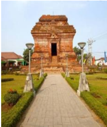
Gambar 14. Candi Pari