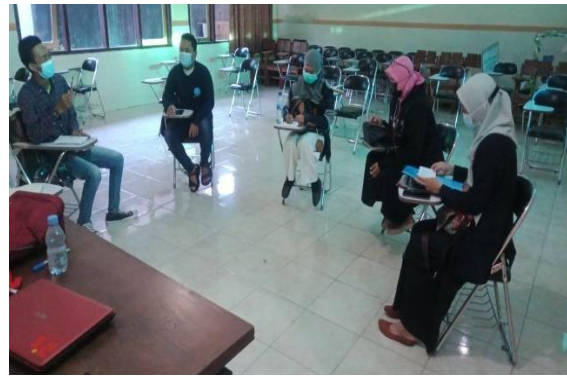
Gambar 2. Mempersiapkan Prasarana Kegiatan