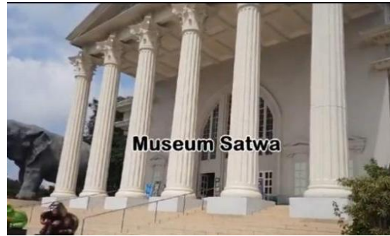
Gambar 8. Cuplikan Layar dari Video TARING