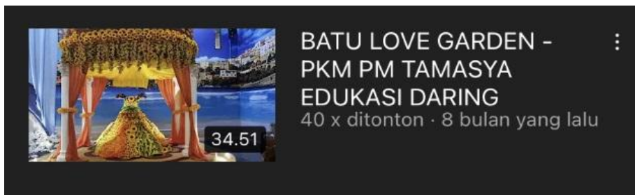
Gambar 9. Video Kedua TARING di Youtube