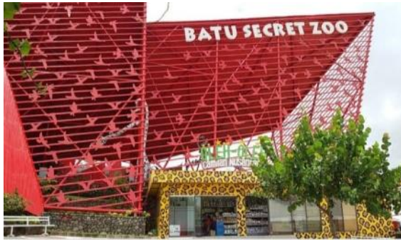
Gambar 7. Cuplikan layar dari video TARING