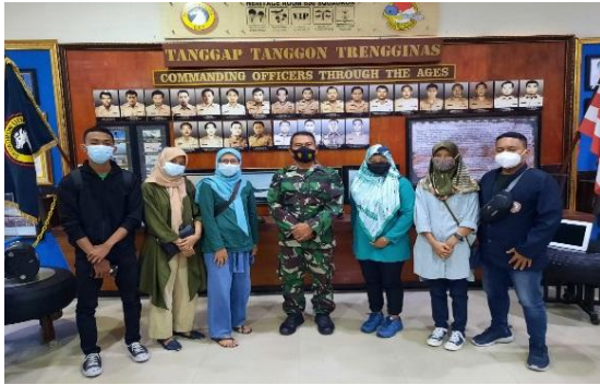
Gambar 4. Proses Pengambilan Video Kegiatan