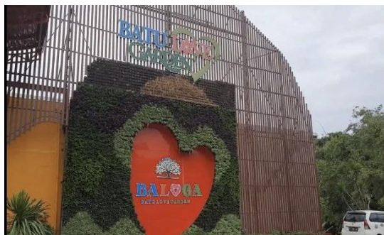
Gambar 10. Cuplikan layar dari Video TARING