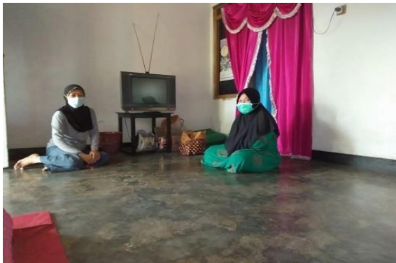
Gambar 1. Perizinan Kepada Pihak Mitra

semangat belajar meskipun tidak dapat bepergian di masa pandemi ini, proses pengambilan gambar dan pembuatan video Tamasya Edukasi Daring untuk peserta didik Bimbel dan TPQ Amanah (Gambar 4), penayangan hasil pengambilan video Tamasya Edukasi Daring kepada peserta didik di Bimbel dan TPQ Amanah. Lalu pada tahap evaluasi, yaitu setelah para peserta didik menyaksikan video yang telah selesai dibuat, diminta mengisi kuisisioner terkait video Tamasya Edukasi Daring ini, yang merupakan salah satu cara dalam memotivasi untuk berkunjung dikemudian hari setelah pandemi usai (Gambar 5). Terakhir yaitu pembuatan laporan hasil program, hal ini bertujuan untuk memberikan data yang benar dan telah disesuaikan dengan hasil yang telah dicapai selama melakukan program kegiatan terhadap masyarakat sasaran yaitu, peserta didik Bimbel dan TPQ Amanah di Kelurahan Suko Legok RT.17 RW.06 Kecamatan Sukodono, Kabupaten Sidoarjo.