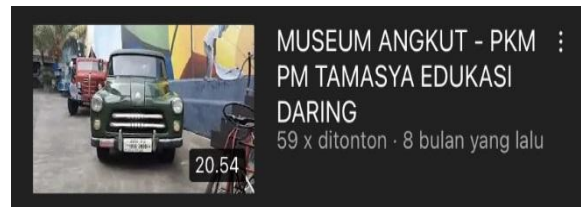
Gambar 11. Video ketiga TARING di Youtube