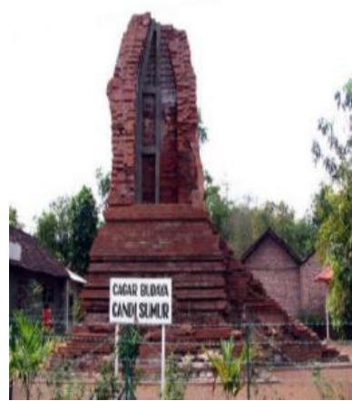
Gambar 15. Candi Sumur