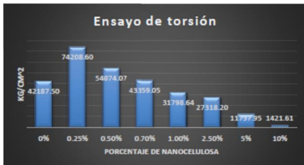
Gráfico 5.