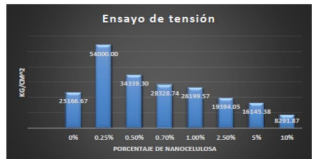
Gráfico 1.