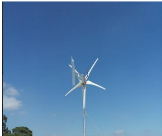
Imagen 1. (Turbina eólica 1700W, Mixco, Guatemala)