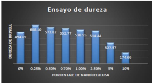
Gráfico 3.