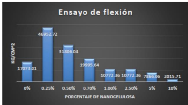
Gráfico 4.