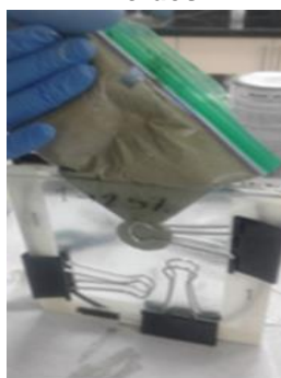
Imagen 2.

Se realizan los ensayos en el Laboratorio Nacional de Nanotecnología de Costa Rica en un reómetro marca