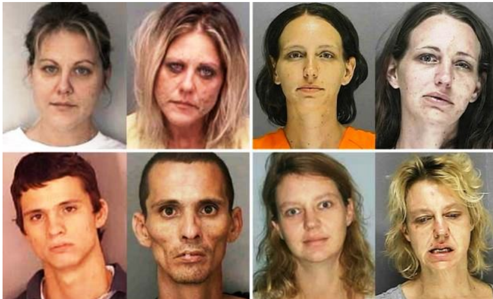
Gambar 1. Perubahan Wajah Pecandu Narkoba

Pemanfaatan teknologi informasi dapat dimanfaatkan untuk mengenali pecandu narkoba (Raghavendra et al., 2016). Penelitian sebelumnya telah dikembangkan aplikasi pengenalan pecandu narkoba menggunakan local binary pattern dan grey level co-occurrence matrix dengan tingkat akurasi diatas 80 % (Priambodo et al., 2021).