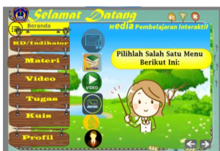
(1) Halaman Menu Utama

Pada tahap pengembangan media atau produk dilakukan pengembangan pada tampilan-tampilan media interaktif berbasis Lectora Inspire . Gambar 1 merupakan gambar tampilan media Lectora Inspire yang dikembangkan.