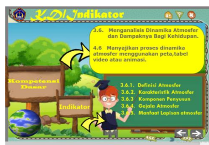
(2) Halaman Menu KD/Indikator