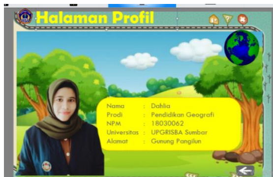
(7) Halaman Profil