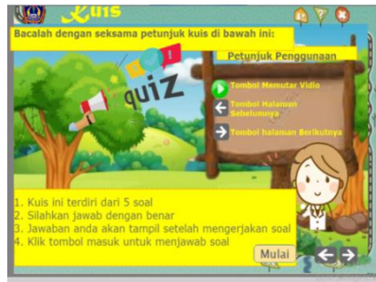
(6) Halaman Menu Kuis