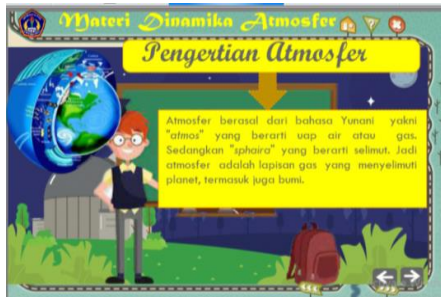
(3) Halaman Materi