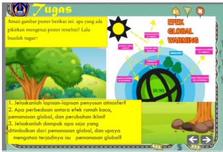
(5) Halaman Menu Tugas