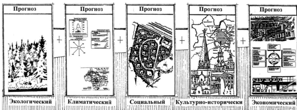
Рис. 1. Уровни рекреационного потенциала регионального кластера ПРК

Основой методологии при проектировании придорожных рекреационных объектов в связанной совокупности в форме кластеров является системный подход и разработка архитектурной типологии зданий. Кластер ПРК рассматривается как динамично развивающаяся открытая система, включающая комплекс следующих подсистем: ландшафтно-градостроительная среда, структурно-функциональные зоны территории, архитектура отдельных зданий и сооружений, входящих в состав ПРК. Данные подсистемы составляют уровни, необходимые для типологического изучения объекта. ПРК представляет собой единое территориальное и композиционное целое, анализируемое по типологическим и архитектурным признакам (рис. 1).