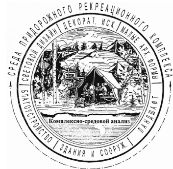
Рис. 2. Архитектурные элементы рекреационного регионального кластера ПРК

Для рационального решения архитектурной формы и оптимального поиска места расположения ПРК необходимо использовать многовариантные матрицы архитектурных элементов регионального кластера (рис. 3).