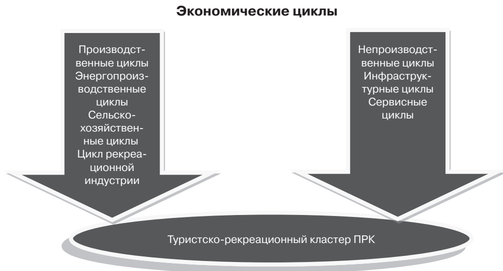
Рис. 4. Циклы рыночной экономики и туристско-рекреационные кластеры

Недостаток кластерного подхода при регулировании развития придорожных рекреационных комплексов (ПРК) в регионах состоит в том, что внимание акцентируется на развитии единичных территорий с высоким уровнем рекреационного потенциала, в то время как многие другие части региона остаются за пределами проектов. В придорожные рекреационные проекты может быть вовлечена вся территория придорожного пространства без исключения. За счет единичных объектов невозможно выйти на новый уровень развития рекреационной индустрии региона. Включить регион в крупные региональные и международные процессы можно только с помощью возможностей всего региона. Через развитие системы объектов ПРК можно выйти на принципиально иные масштабы этой деятельности. Для этого необходимо использовать только кластерный подход.