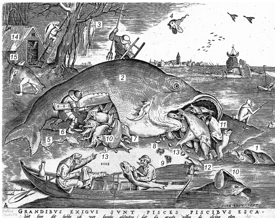
Рис. 2. Питер Брейгель Старший — «Большая рыба ест мелкую рыбу», гравюра Питера ван дер Хейдена, 1557 [цит. по работе 11] по мотивам рис. 1:

песням примитивных северных народов, в большинстве случаев связан с обликом растений и животных, горными долинами, которые окружали поэта, и воздухом, который его обвевал». Если бы Брейгеля обвевал сухой и горячий воздух пустыни Гоби, вряд ли можно было увидеть его знаменитый рисунок, даже при условии крайней социальной несправедливости среди народов, населяющих это безводное пространство в центре Азии.