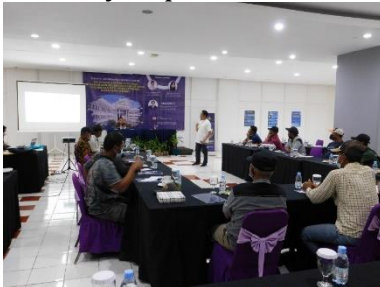
Gambar 1. Penyampaian Materi Pelatihan

Materi yang disampaikan dalam kegiatan ini adalah konsep dasar aksesibilitas permodalan, Lembaga keuangan Syariah, maksud dan tujuan aksesibilitas permodalan, ruang lingkup aksesibilitas Lembaga keuangan Syariah, dan prosedur pengajuan pembiayaan ke Lembaga keuangan Syariah. Hasil kegiatan ini dapat dilihat pada hasil evaluasi mengenai peningkatan pengetahuan dan pemahaman peserta mengenai pengajuan pembiayaan ke Lembaga keuangan Syariah. Berdasarkan hasil evaluasi sebelum dan sesudah kegiatan pelatihan diperoleh hasil terdapat peningkatan pengetahuan dan pemahaman peserta menjadi lebih baik. Berikut ini hasil evaluasi pengetahuan dan pemahaman peserta dalam pengajuan pembiayaan ke Lembaga keuangan Syariah.