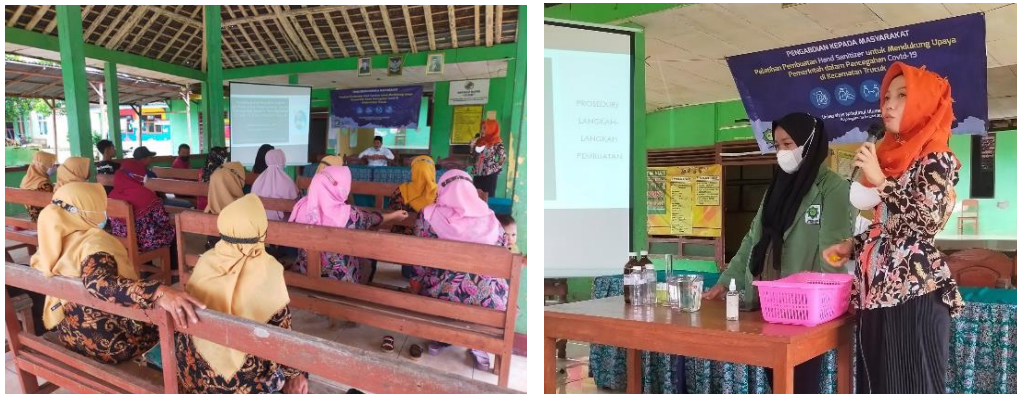
Gambar 1. Tim memberikan materi dalam pelatihan pembuatan hand sanitizer.

Sebagian besar peserta mulai menangkap dan memahami materi yang telah disampaikan oleh pemateri. Peserta aktif dalam menanggapi pemateri dan menangkap umpan berupa tanya jawab yang telah diberikan oleh pemateri.