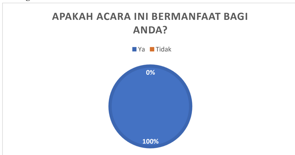
Gambar 2. Grafik manfaat acara pelatihan pembuatan hand sanitizer.

Pada tahap akhir disebarakan instrumen angket kepuasan peserta untuk mengetahui kepuasan masyarakat terhadap keseluruhan kegiatan. Hasil pengisian instrumen kepuasan oleh peserta ditunjukkan oleh diagram diagram sebagai berikut.