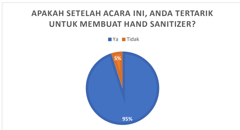
Grafik 4. Ketertarikan peserta untuk membuat hand sanitizer sendiri setelah mengikuti pelatihan.

Hasil responden berdasarkan angket yang telah disebar yang disajikan pada Grafik 1, Grafik 2, dan Grafik 3 menunjukkan bahwa para peserta antusias mengikuti serangkaian acara pelatihan dan sebagian besar akan menerapkan ilmu yang telah diajarkan dalam pembuatan hand sanitizer yang sesuai dengan standart WHO. Para peserta juga semuanya tertarik untuk mengikuti acara pelatihan-pelatihan yang lain dengan topik yang berbeda. Dari hasil angket juga terdapat beberapa masukan dari peserta terkait pelaksanaan, salah satunya adalah waktu pelaksanaan yang kurang lama.