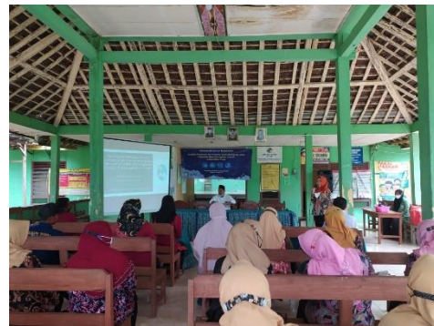
Gambar 6. Pemaparan materi 2