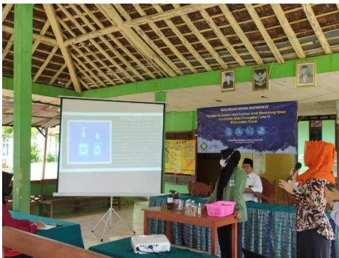
Gambar 5. Pemaparan materi 1.