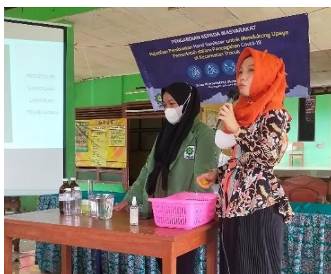
Gambar 7. Pelatihan pembuatan hand sanitizer.