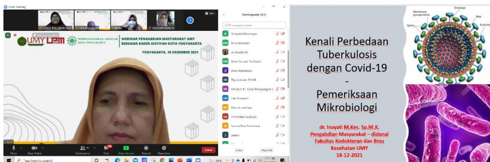
Gambar 1. Pelaksanaan pemberian materi penyuluhan tentang Perbedaan Tuberkulosis dengan COVID-19

Materi teori tentang “Kenali Perbedaan Tuberkulosis dengan Covid-19 berdasarkan Pemeriksaan Mikrobiologi” disampaikan dengan metode penyuluhan dua arah disampaikan kepada 30 kader Tuberkulosis Aisyiyah secara online melalui Zoom Meeting tentang Definisi, Tanda/gejala dan Pemeriksaan Laboratorium Mikrobiologi pada Tuberkulosis dan Covid-19. Pelaksanaan pemberian materi pada Pengabdian Masyarakat dilakukan pada hari Sabtu 18 Desember 2021 dan diikuti oleh Kader Tb-Care Aisyiyah sebanyak 30 orang. Pemberian materi berjalan lancar dan interaktif. Pertanyaan dan diskusi cukup interaktif antara narasumber dengan Kader Tb-Care. Seperti terlihat pada Gambar 1.