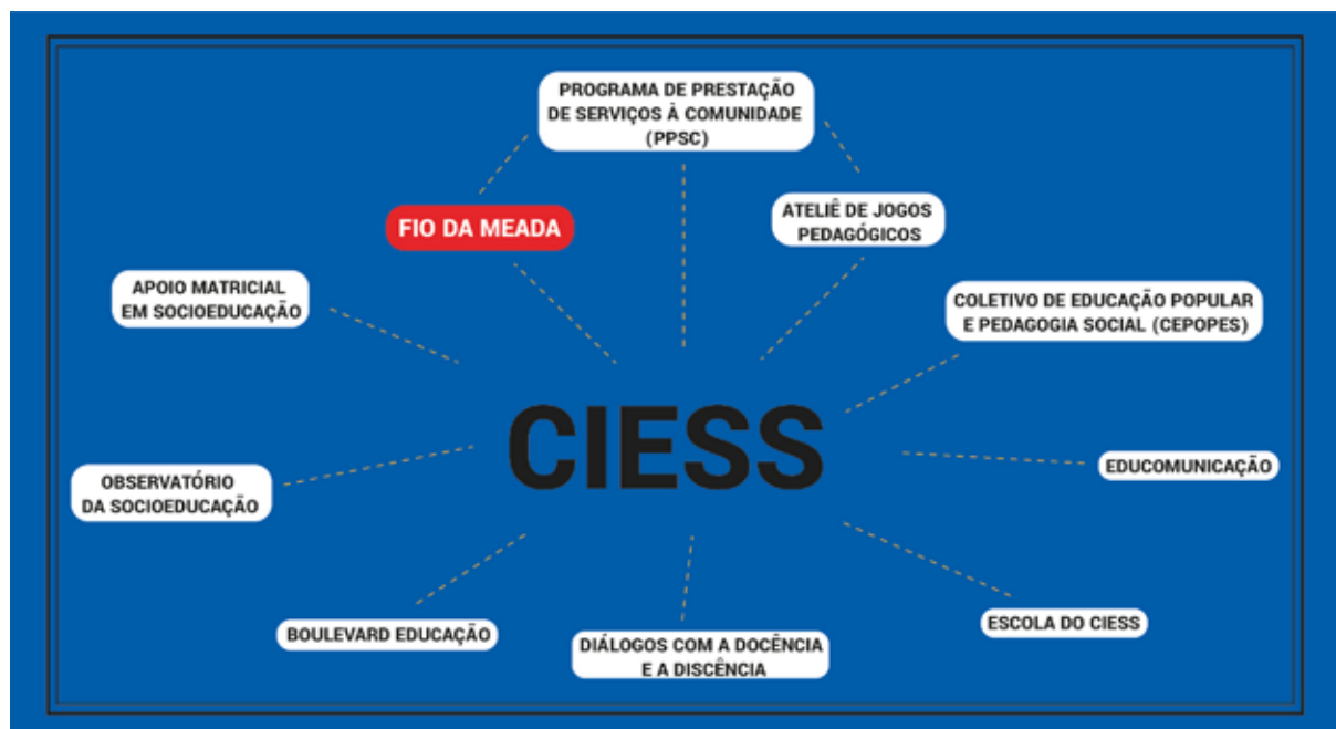
Figura 1 – Organograma com todos os projetos que compõem o CIESS