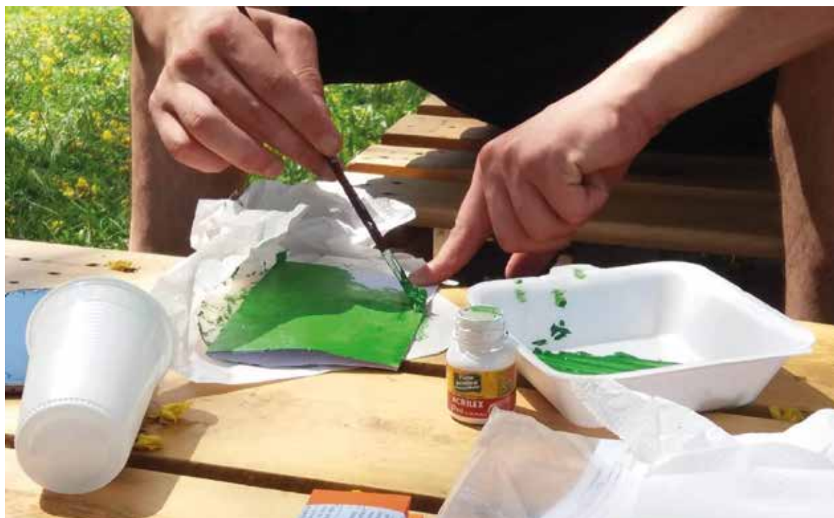
Figura 2 – Adolescente em cumprimento de MSE de PSC no setor de trabalho