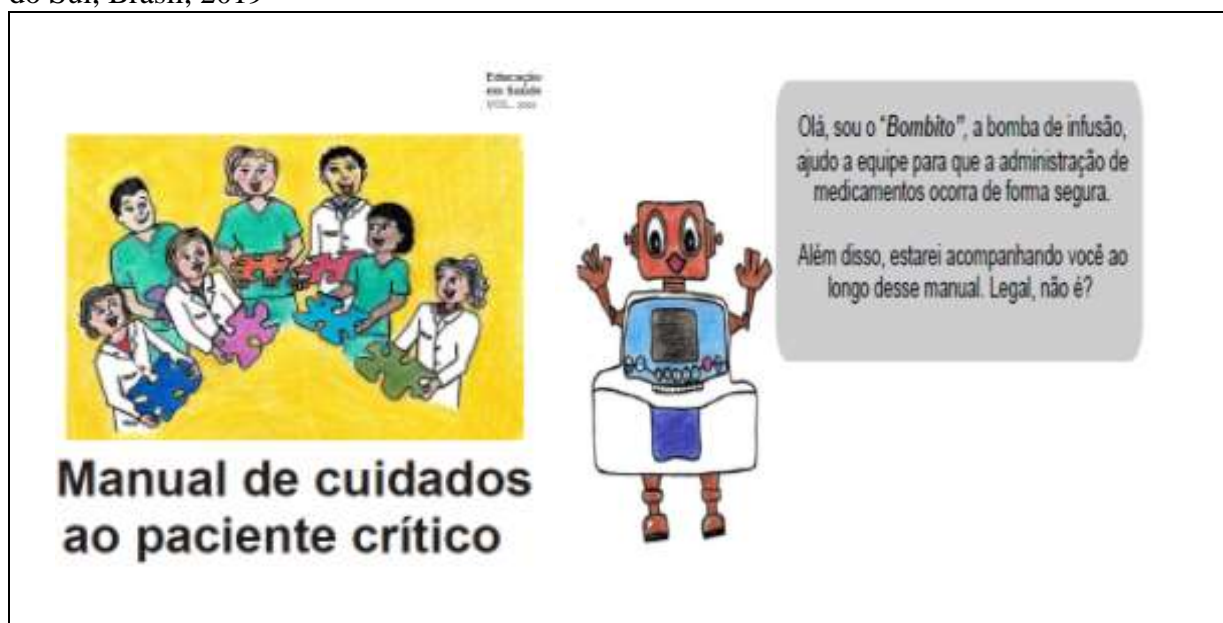
Figura 1 - Layout da capa do manual e do personagem “Bombito”. Porto Alegre, Rio Grande do Sul, Brasil, 2019

A Figura 1 apresenta o layout da capa do manual desenvolvido e validado, intitulado de “Manual de cuidados ao paciente crítico” (20) e a bomba de infusão chamada de “Bombito”, que interage com o leitor, o qual destaca pontos importantes ao longo do texto.