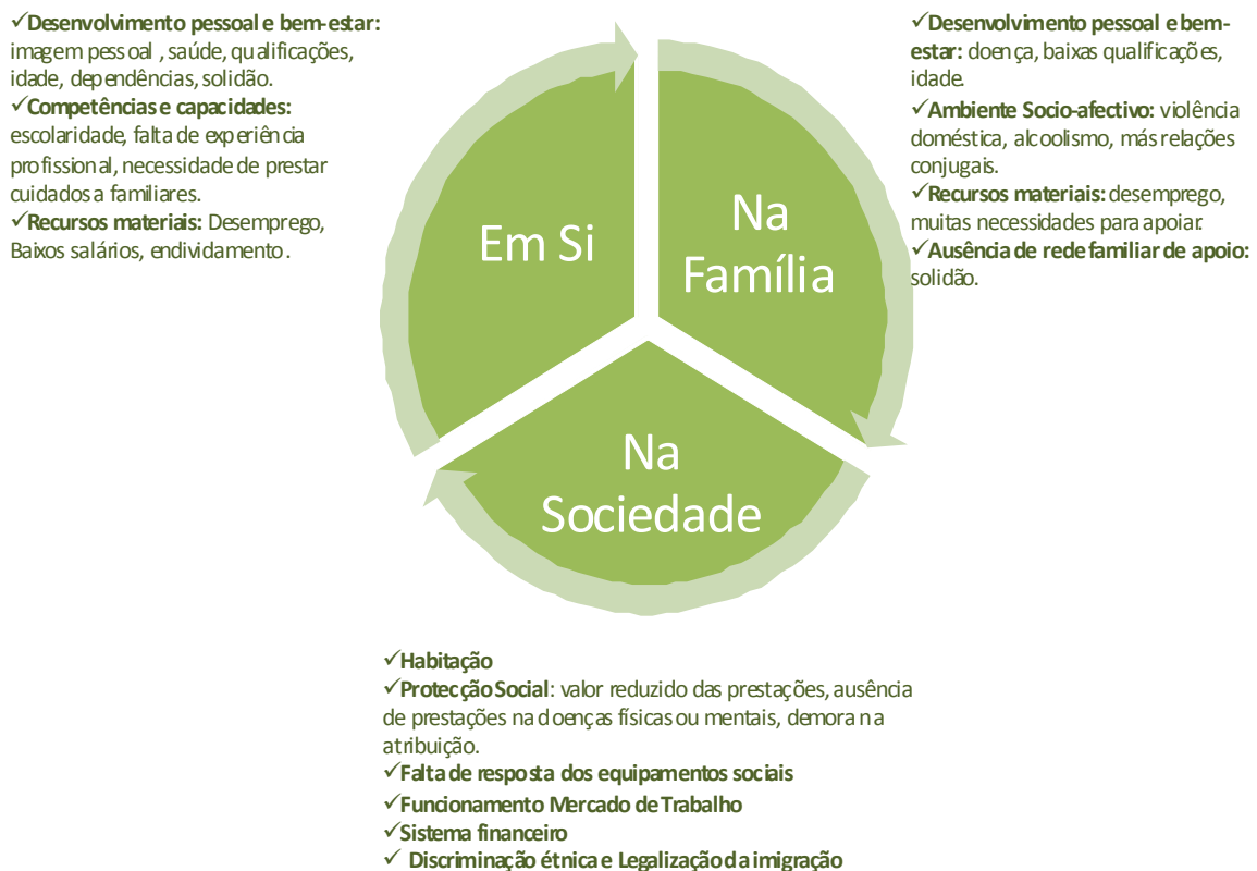
Figura 2. Auto percepção dos problemas actuais