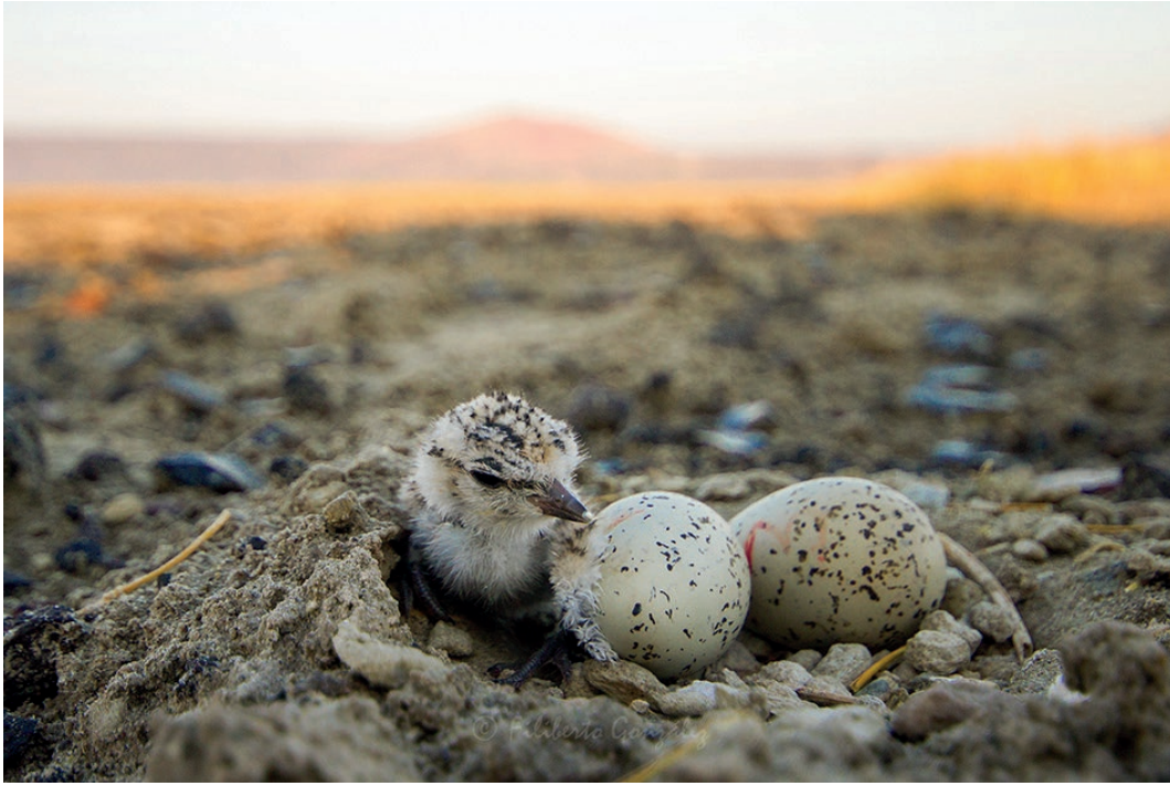
Figura 2. Polluelo de chorlo nevado Charadrius nivosus recién eclosionado en la laguna de Atotonilco, Jalisco, México.