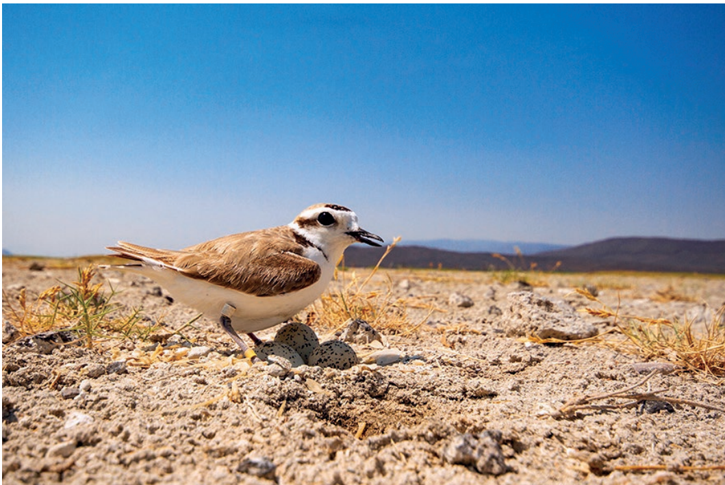
Figura 1. Macho adulto del chorlo nevado Charadrius nivosus en un nido con tres huevos durante la temporada reproductiva de 2020 en laguna de Atotonilco, Jalisco, México.

Durante la temporada reproductiva se contabilizaron un total de 165 individuos de C. nivosus , los cuales correspondieron a 140 machos (85%) y 25 hembras (15%); además de 15 individuos a los que no fue posible identificar el sexo, por lo que no se tomaron en cuenta en el conteo total (Tabla 1).