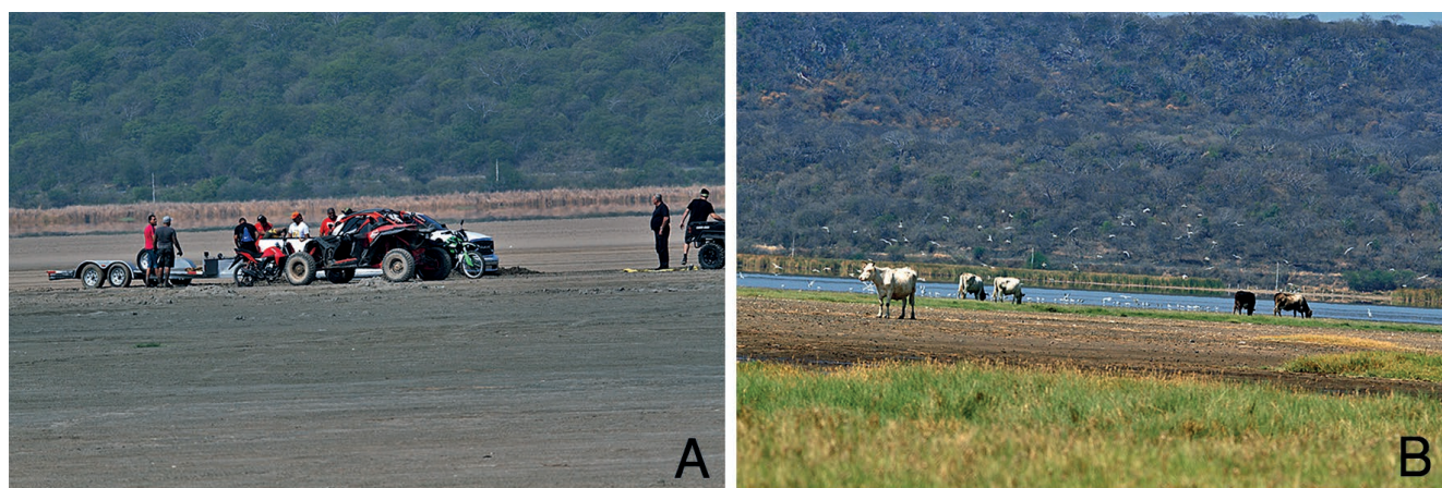
Figura 4. Actividades identificadas como las principales amenazas para la colonia de chorlo nevado Charadrius nivosus en la laguna de Atotonilco, Jalisco, México. A) uso de diversos tipos de vehículos, B) presencia de ganado.