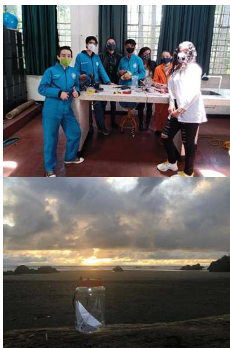
Figura 5. Proyecto Luces de paz: estudiantes del semillero realizando las lámparas y entrega de las lámparas por parte de la ONG Agencia Social.

Esta fue una oportunidad de afianzar las relaciones sociales al interior del semillero, en donde afloraron los sentimientos y la carga afectiva (Quintar, 2008) de los participantes. Aspectos fundamentales para el proceso pedagógico, que permitieron afianzar relaciones de amistad y empatía entre docentes y estudiantes alrededor del trabajo manual de la fabricación de lámparas. El proyecto “Luces de Paz” llegó a los municipios de Nuquí y Bahía Solano, Chocó, en especial a sus niños (Figura 5).