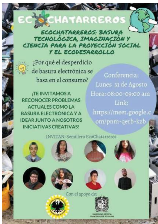
Figura 4. Volante publicitario.