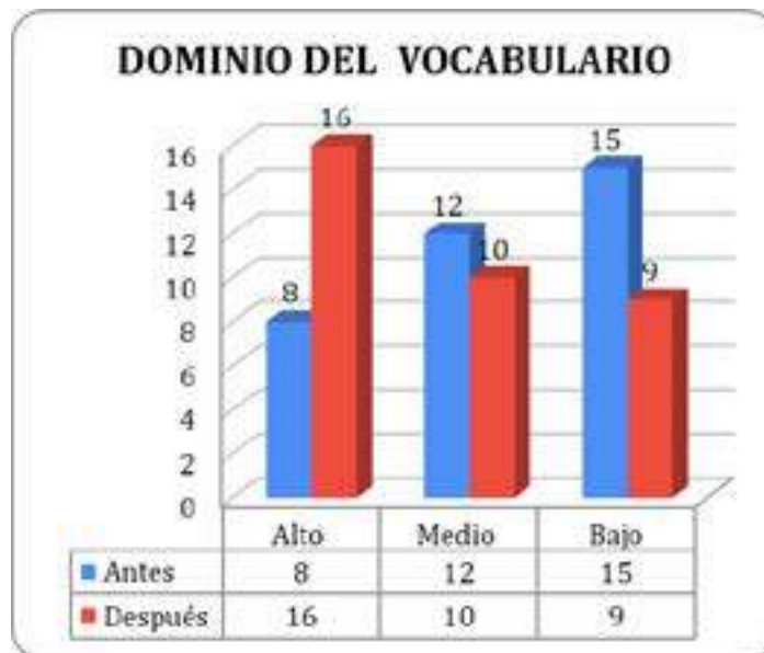
Gráfica 2: dominio del vocabulario.

Ahora se dará paso a los resultados relacionados con el dominio del vocabulario antes y después del uso del podcast, ilustrados en la gráfica número 2.