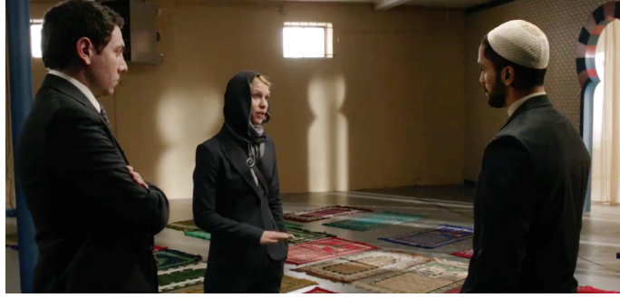
Resim 3. Carrie Mathison ve Camii İmamı Görüşmesi

Dizinin ikinci sezonunda, dini motifli terör grupları tarafından gerçekleştirilen en büyük terör eylemi CIA'ye yönelik bir bombalı saldırıdır (Resim 4). Bu eylem sonucu aralarında üst düzey devlet yetkilileri bulunan 200'den fazla insan öldürülmüştür. Saldırı sonrası El Kaide militanlarının yaptığı açıklamada “Siz bizim ulusumuzu yakıp yıkmaya çalıştınız, biz de sizinkini yakıp yıkacağız inşallah. Allah en yüce olandır.” sözleri terörle İslam'ın beraber anılmasına sebep olmaktadır.