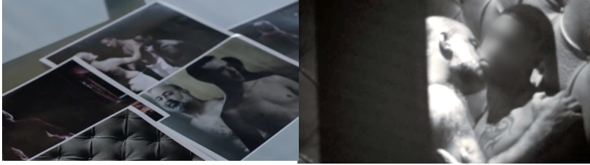
Resim 9. Suudi Diplomatın Mahrem Görüntüleri

İslam ve cinsellik ilişkisi bağlamında bir diğer olumsuz temsil ilk sezonun onuncu bölümünde yer almaktadır. CIA soruşturmaları kapsamında Abu Nazir ile doğrudan bağlantısı olduğu düşünülen Suudi Arabistan Büyükelçisi Diplomatı takibe alınmıştır. Yapılan araştırmalar sonucu Suudi diplomat Mansour Al-Zahrani'nin eşcinsel olduğu bilgisine ulaşılarak mahrem görüntüleri ele geçirilmiştir (Resim 9). Arap diplomat, bu sahnede yaramaz bir dindar ve Müslüman olarak tanımlanmaktadır.