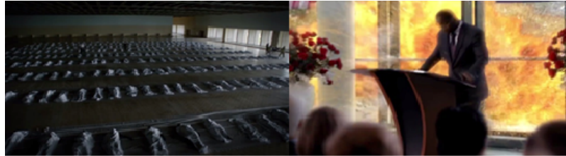
Resim 4. CIA Bombalı Saldırısı

İslam'a ve Müslüman kimliğine zarar veren bir diğer olumsuz temsil ilk sezonun final sahnesinde görülmektedir. Amerikan Başkan Yardımcısı William Walden'in başkanlık adaylığını açıklayacağı konuşmada Abu Nazir tarafından bir terör eylemi planlanmıştır. Ancak eylemin başarısız olması sonucunda Brody ile Walker karşı karşıya gelmektedir. Nazir, Walker'ı bir tehdit olarak gördüğünden telefonda Brody'e onu öldürmesini söyler. Brody, arkadaşını ikinci defa gözünü bile kırpmadan öldürür. Brody ve Nazir, konuşmasını “elhamdülillah” (Allah'a şükürler olsun) diyerek sonlandırır (Resim 5). İçerikte bu gibi dini söylemlere yer verilmesi İslam'a ve Müslümanlara yönelik olumsuz algıyı güçlendirmektedir.