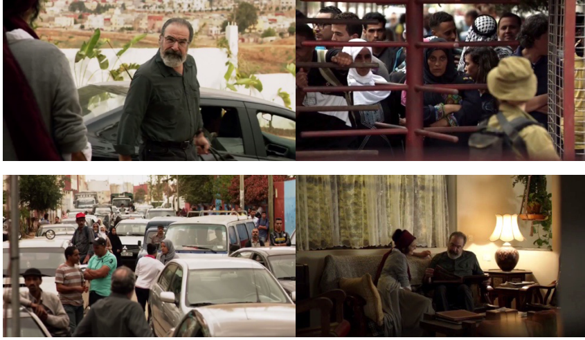
Resim 7. Saul Berenson'un Filistin Ziyareti