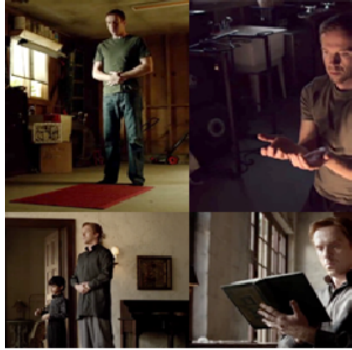
Resim 11. İçerikte Kullanılan Dini Ritüeller

Çalışma kapsamındaki bir başka analizde ise İslam dinine yönelik içerikte kullanılan dini ritüeller incelenmiştir (Tablo 7). Buna göre Homeland genelinde İslam dini, namaz ve ezan ritüelleri ile temsil edilmektedir (Resim 11).