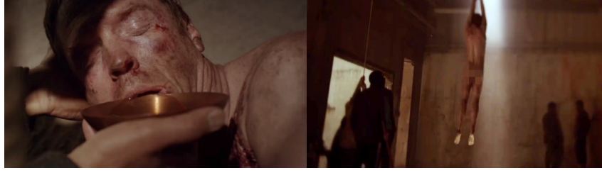
Resim 2. Nicholas Brody, İşkence Sahneleri

İlk sezonun son bölümlerine doğru Brody ile birlikte esir alındıktan sonra öldürüldüğü düşünülen Tom Walker'ın gerçekte yaşadığı ve bir terör faaliyeti içinde olduğu ortaya çıkmıştır. CIA tarafından Walker'ın yeri tespit edilmiş ancak FBI tarafından gerçekleştirilen operasyonda Walker bir camii girerek izini kaybettirmiştir. Olay sonrası caminin imamı ile yapılan görüşmeden, camii cemaatinin Walker'ı tanıdığı ve onu korumaya çalıştıkları anlaşılmaktadır (Resim 3). Bu sahnedeki ifadelere bakıldığında söz konusu içerikte Müslüman cemaat ve terörist ilişkisini güçlendiren bir yaklaşım izlendiği sonucuna ulaşılabilmektedir.