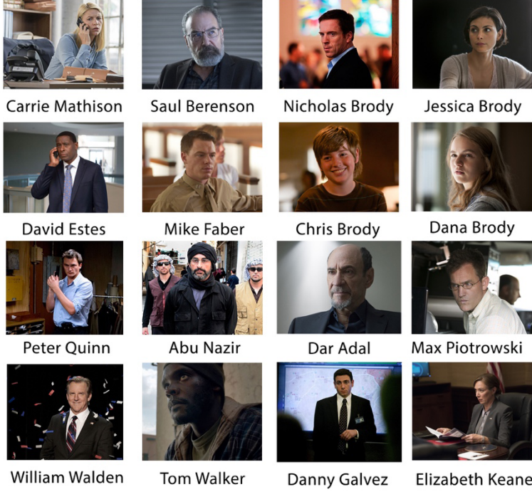
Resim 1. Homeland Ana Karakterler