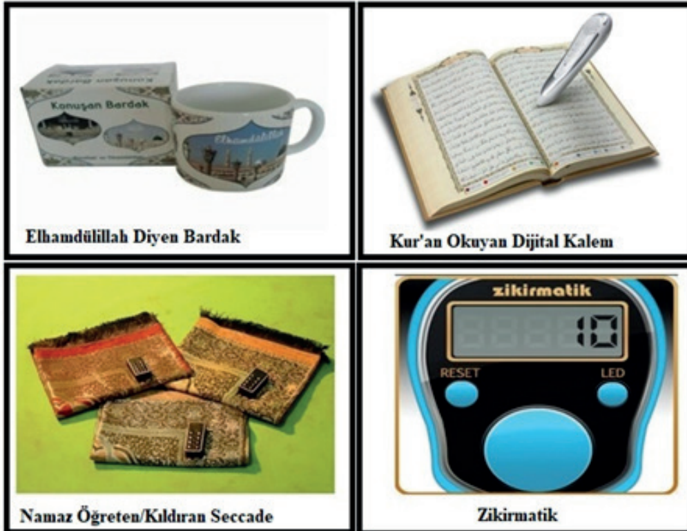
Resim 2. Dini Pratiklere Yardımcı ve Onları Kolaylaştırıcı Dijital Cihazlar

samında olup olmayacağı akla gelmektedir. Bu cihazların dini pratiklerde yardımcı unsur olması ile “Dijital Din” kapsamı içerisine alınması arasında ince, ama önemli bir farklılığa dikkat çekmek gerekmektedir. Dijital Din, çevrimiçi ve çevrimdışı dini alanların harmanlandığı veya bütünleştiği tekno-kültürel uzam olarak tanımlanmaktadır (Campbell, 2013, s. 3-4). Oysaki sözü edilen dijital cihazların, Hoover ve Echchaibi'nin vurgu yaptığı ve geçişken bir alan olan üçüncü uzam içerisinde yer almadıkları görülmektedir. Bu cihazlar, bir kısım dini pratiklere yardımcı veya kolaylaştırıcı işlevi olan çevrimdışı dijital cihazlardır. Dolayısıyla, temelde çevrimdışı çalışmak ve kullanılmak üzere tasarlanmış bu cihazları -her ne kadar dini pratiklerle etkileşime giriyor olsalar bile- çevrimiçi bir uzam kazanmadıkları sürece “Dijital Din” kapsamında değerlendirmemek daha isabetli görülmektedir.