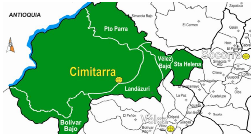
Figura 1. Mapa del Carare Opón, 2015

Posteriormente, el territorio fue habitado por migrantes de diversas regiones del país, en su mayoría por colonos que huían de la violencia bipartidista de los años 50 que se ubicaron en la zona para su explotación agropecuaria. Estos primeros colonos habitaron el territorio de manera pacífica hasta que diferentes grupos armados empezaron a colonizar el territorio con el fin de establecer plantaciones de coca y cobrando impuestos a la explotación petrolera, ganadera, minera, entre otras; es así como las generaciones de campesinos descendientes de los primeros migrantes se convirtieron en blanco de las torturas, desapariciones y asesinatos de los diferentes grupos armados que hacían presencia en la región e intensificaron la violencia en el territorio desde los años 60, alcanzando su punto máximo a finales de los 70 y principios de los 80; estos campesinos serían quienes darían vida a la Asociación de Trabajadores Campesinos del Carare (ATCC) como un ejercicio de resistencia pacífica ante la violencia que se padecía en la región.