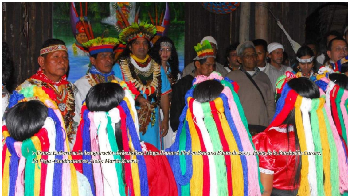
Figura 3. Danza Embera en la inauguración de la maloca Maya Kamurú Pirú, La Vega-Cundinamarca, 2009