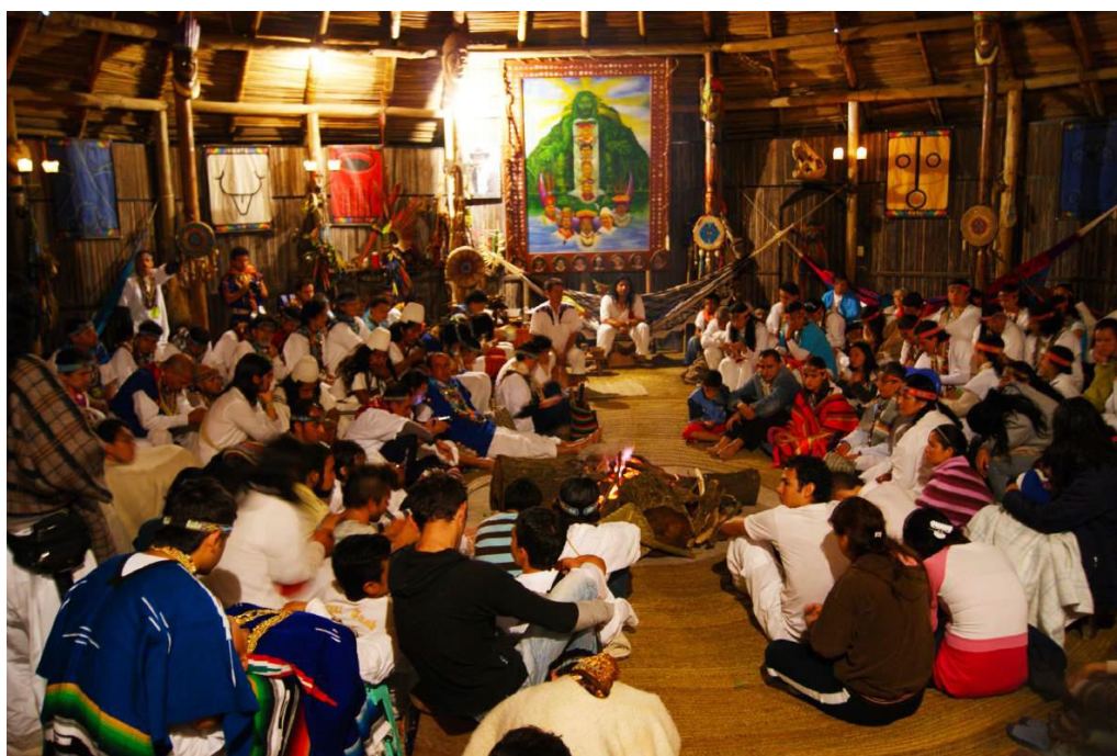
Figura 4. Maloca Maya Kamurú Pirú 2012.

adoptadas pero que en el ejercicio de mediación son resignificadas dando lugar a una forma particular de realizar dichas prácticas.