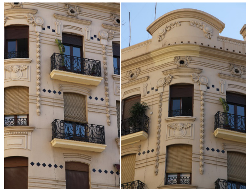
Fig. 11 y 12. Detalles Edificio Francisco Sancho, 1907. Arquitecto: Demetrio Ribes Marco. Situación: Marqués del Turia nº 1.

Otros muchos arquitectos y maestros de obra practicaron también este tipo de arquitectura. Así tenemos a Francisco Almenar,