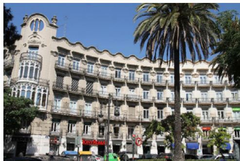
Fig. 2 y 3. Edificios Chapa, 1909. Arquitecto: Carlos Car-bonell. Situación: Gran Vía Marqués del Turia 65-71, Pza. Canovas 1 y 3, c/ Grabador Esteve 36 y 38.