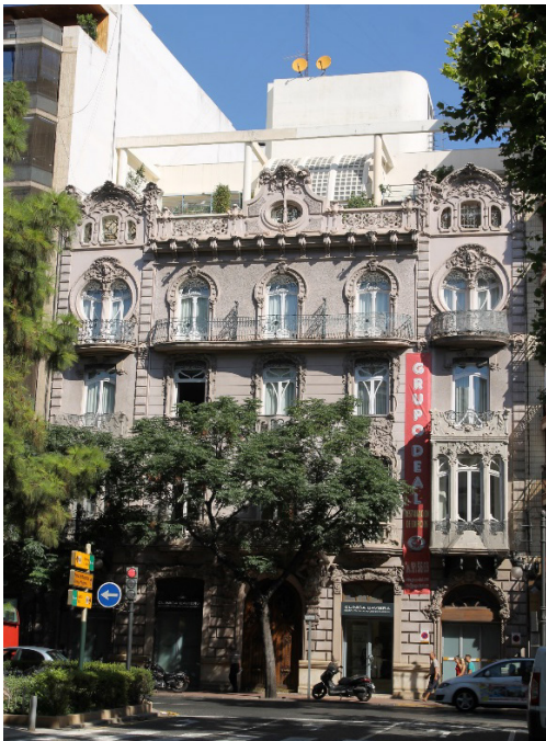
Figura 1. Edificio Ortega, 1906. Arquitecto: Manuel Peris Ferrando. Situación: Gran Vía Marqués del Turia n°9.

Una vez que las fuerzas vivas de la sociedad han tomado conciencia de la necesidad de mejorar la situación urbana en los diferentes campos de salubridad, alta densidad habitantes y de calidad del caserío, que permitieran a la ciudad afrontar con competitividad la nueva era recién comenzada, se acometieron las primeras reformas y modificaciones del tejido urbano en el casco histórico; que se continuará con la ampliación de la ciudad coincidiendo con la demolición de las murallas, lo que originará el Ensanche de la ciudad de la Valencia.