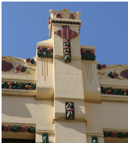
Fig. 16 y 17. Estación del Norte de Valencia (inaugurada en 1917). Arquitecto: Demetrio Ribes Marco.