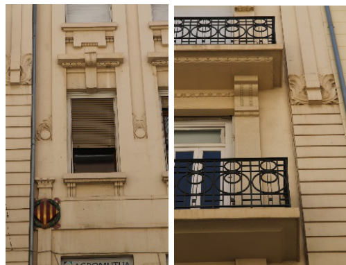
Fig. 13,14 y 15. Edificio Pérez Pujol, 1911. Arquitecto: Demetrio Ribes Marco. Situación: C/ Pérez Pujol nº 5.