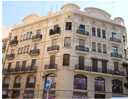
Fig. 9 y 10. Edificio Francisco Sancho, 1907. Arquitecto: Demetrio Ribes Marco. Situación: Marqués del Turia nº 1.

ridad estructural con que está desarrollada no hacen sino subrayar.