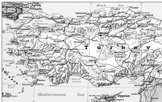
Anatólia a bronzkorban

Visszatérve Zalpa és Zalpuwa megkülönböztetéséhez: az Anitta-szöveg újhettita másolata (KUB 36.98a) a „Zalpuwa” alakot használja, míg a régebbi szöveg a „Zalpa” alakot szerepelteti. A két változat közötti különbség csak a feltételezések szintjén ragadható meg: míg a „Zalpa” alak a várost, a „Zalpuwa” forma az országot jelölheti. 24