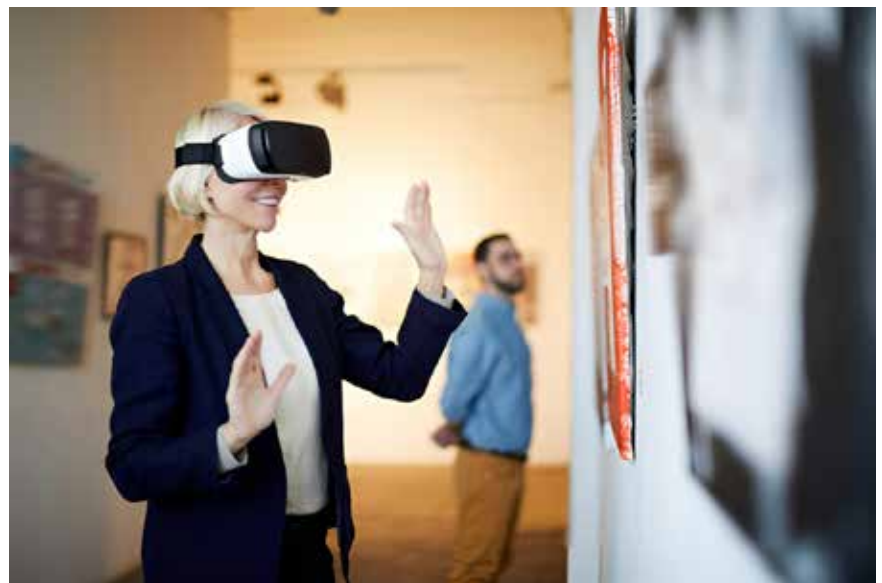
2. ábra: VR-szemüveggel múzeumban

A Szabadtéri Néprajzi Múzeum Múzeumi Oktatási és Módszertani Központja 2021. január 21. – február 8. között végzett intézményi reprezentatív felméréséből (N=203) kiderül, hogy a saját bevételek átlagosan 47%-kal csökkentek 2020-ban a 2019. évhez képest. 184 válaszadó több mint fele home office-t rendelt el a dolgozói számára – akárcsak a sportszektor több területén (Gósi,