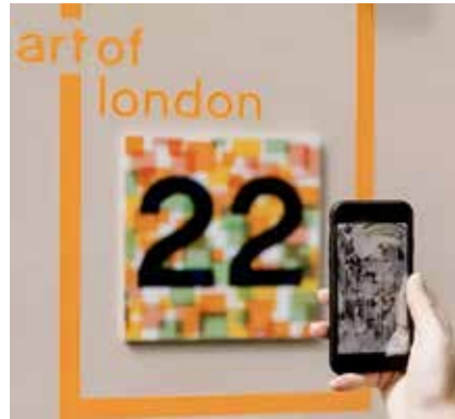
1. ábra: AR használata múzeumban

Az AR (Augmented Reality = kiterjesztett valóság): digitális információ (kép, szöveg, hang) jelenik meg egy olyan képen, amelyet látunk. Ehhez okostelefont vagy táblagépet tart a látogató a kép elé, letölthető alkalmazás segíti a látogatói élmény elérését (Coates, 2022). (1. ábra)