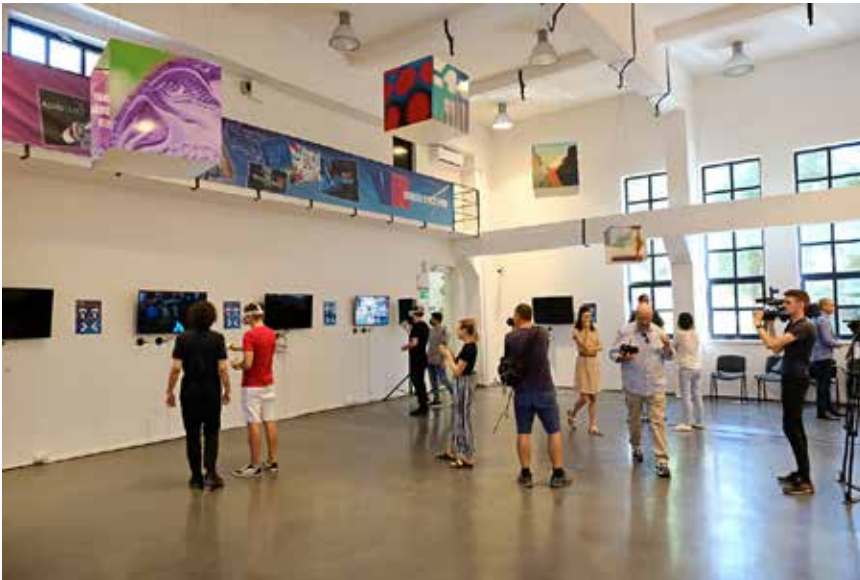
3. ábra: VR Univerzum a Zsolnay Kulturális Negyedben, Pécsen

Image 3: VR Universe in Zsolnay Cultural Quarter, Pécs, Hungary