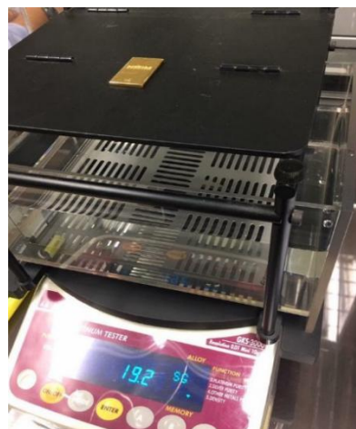
Rajah 7: Tentukan densimeter dengan menggunakan piawaian emas

Piawaian emas digunakan sebagai standard rujukan untuk tentukan densimeter dan alat timbangan. Oleh itu, semua instrumen pengukuran ketulenannya dapat dikesan ke unit SI dan nilai pengukurannya lebih tepat dan seragam apalagi untuk mengelakkan kesilapan semasa pengukuran. Selanjutnya, perdagangan emas akan meningkat dan keyakinan pengguna dapat dipertingkatkan. Rajah 7 menunjukkan tentukan densimeter pelangan menggunakan piawaian emas.