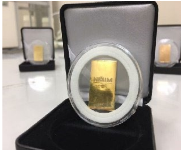
Rajah 6: Piawaian emas Malaysia

Piawaian emas digunakan sebagai standard rujukan untuk tentukan densimeter dan alat timbangan. Oleh itu, semua instrumen pengukuran ketulenannya dapat dikesan ke unit SI dan nilai pengukurannya lebih tepat dan seragam apalagi untuk mengelakkan kesilapan semasa pengukuran. Selanjutnya, perdagangan emas akan meningkat dan keyakinan pengguna dapat dipertingkatkan. Rajah 7 menunjukkan tentukan densimeter pelangan menggunakan piawaian emas.