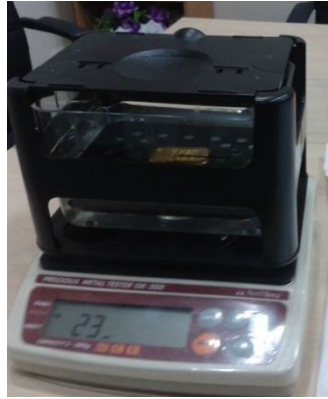
Rajah 2: Densimeter digunakan untuk mengukur ketulenan emas

al., 2011). Alat timbangan dan densimeter adalah antara instrumen yang boleh dipercayai untuk menentukan ketulenan emas menggunakan kaedah penimbangan hidrostatik (Mercer, 1992). Rajah 2 dan Rajah 3 masing-masing menunjukkan pengukuran ketulenan emas menggunakan densimeter dan alat timbangan.