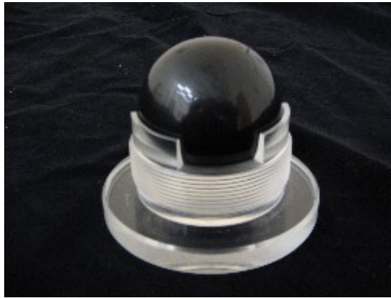
Rajah 5: Sfera kristal di NMIM sebagai piawaian ketumpatan

menggunakan air suling sebagai standard cecair (Bigg, 1967; Patterson and Morris, 1994; Tanaka et al., 2001).