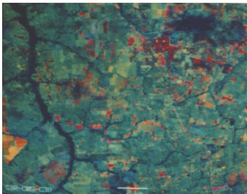
Fig. 3 - Composição colorida obtida para as três primeiras componentes principais (CP) através do subconjunto de bandas TM 1 a 5 e 7. CP1-R/ CP2-G/ CP3-B.