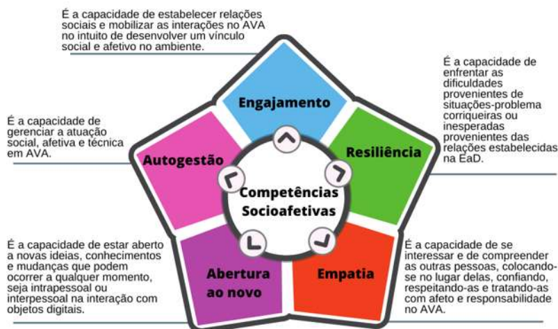
Figura 3 - Definição das CSA elencadas no estudo de caso.

Os dados do estudo de caso juntamente com o referencial teórico desenvolvido, permitiu a discussão e identificação das competências socioafetivas, cujas definições estão apresentadas na figura 3.