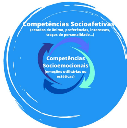
Figura 1 - Relação entre Competências Socioafetivas e Competência Socioemocionais

reconhecidas nos AVA. Tal definição está baseada nos preceitos piagetianos e no modelo schereriano para explicar, respectivamente, a importância das interações sociais na construção do conhecimento e um determinado fenômeno afetivo. A figura 1 exibe a relação entre a CSA e a CSE para o sujeito da EaD (BEHAR, 2019).