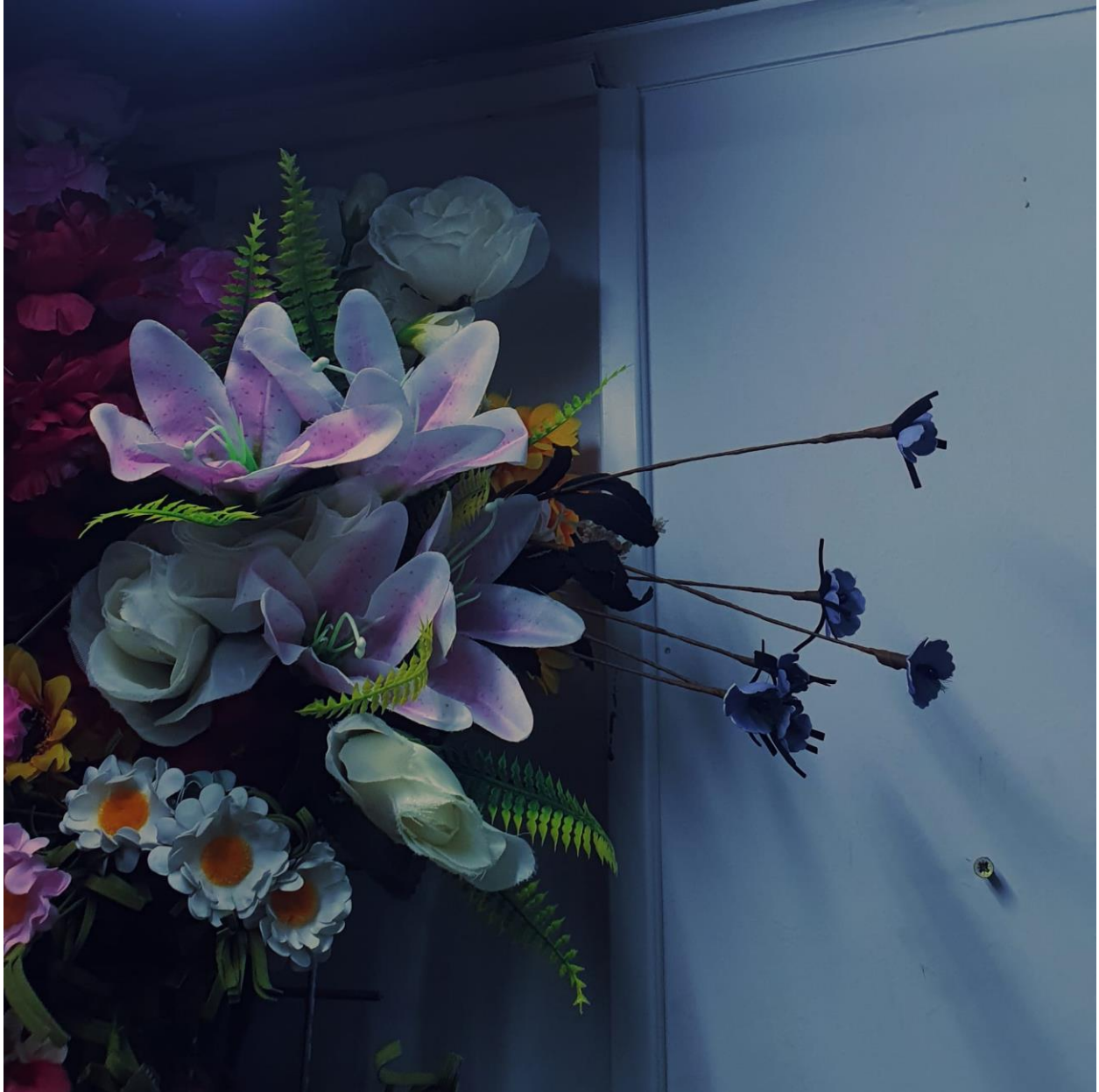
Capa do EP1, por Manuela Falcão.