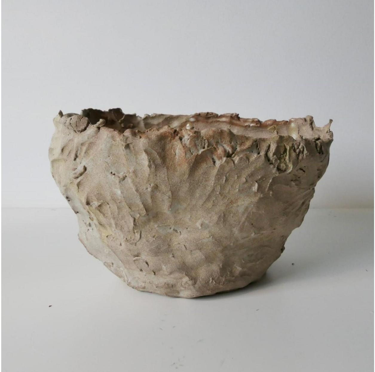
Capa do EP2, por Manuela Falcão.