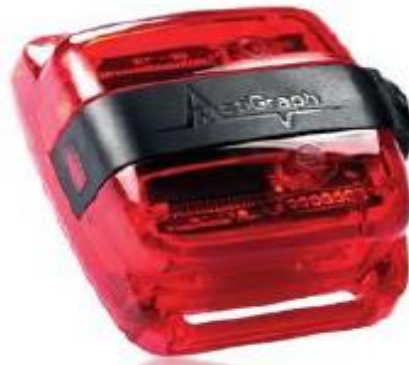
Figura 1 – Acelerômetro wGT3X-BT® da ActiGraph.