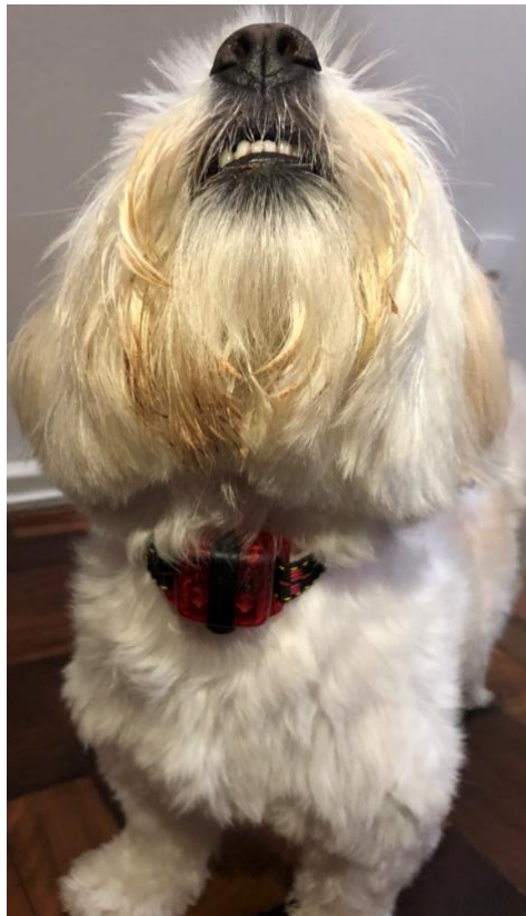
Figura 2 – Monitor posicionado ventralmente no pescoço do cão e fixado através de uma coleira.